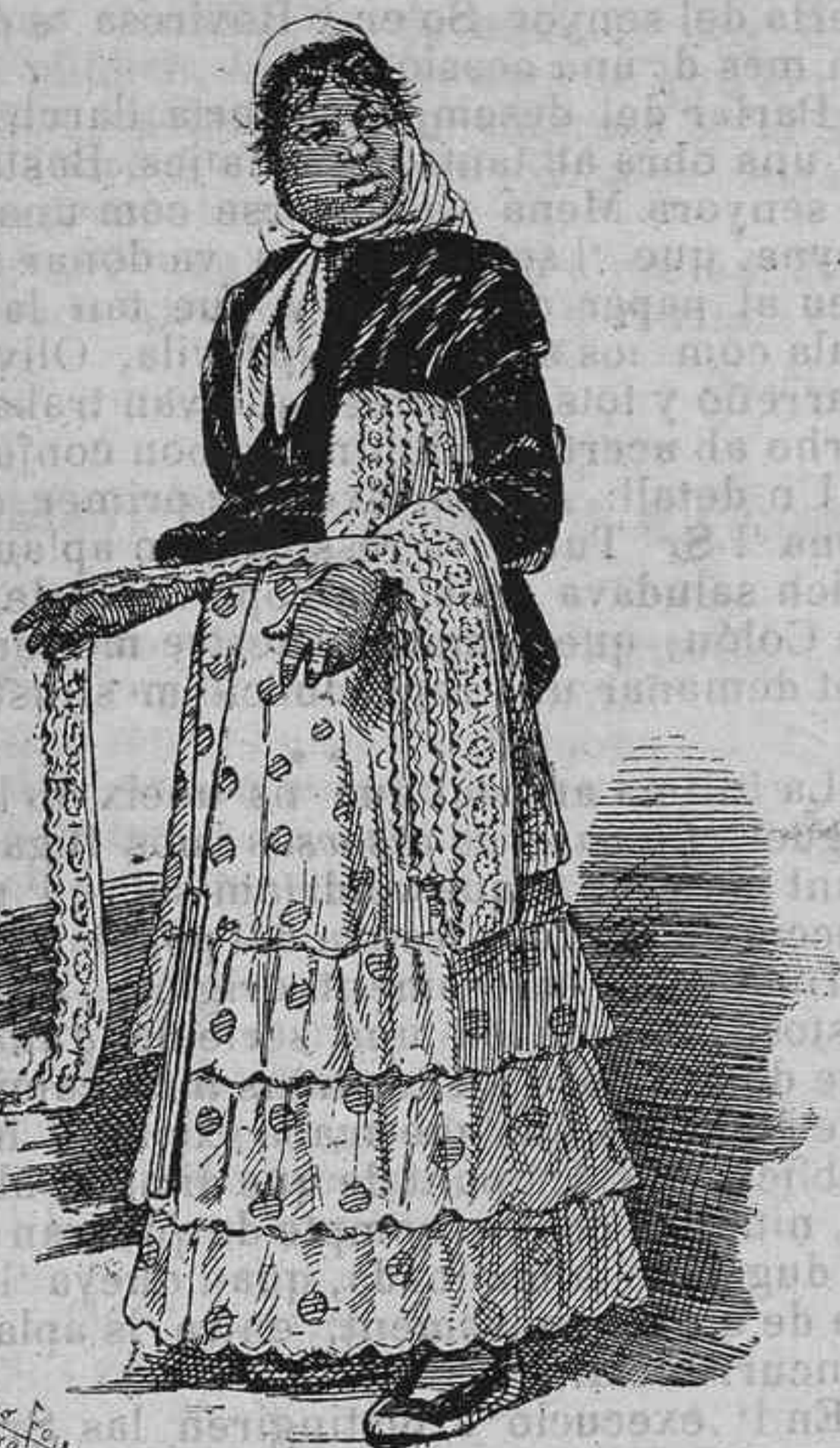
—Veyám si ara, ab tants nobles que han fet, vendré forsa puntas per guarnir uniformes!