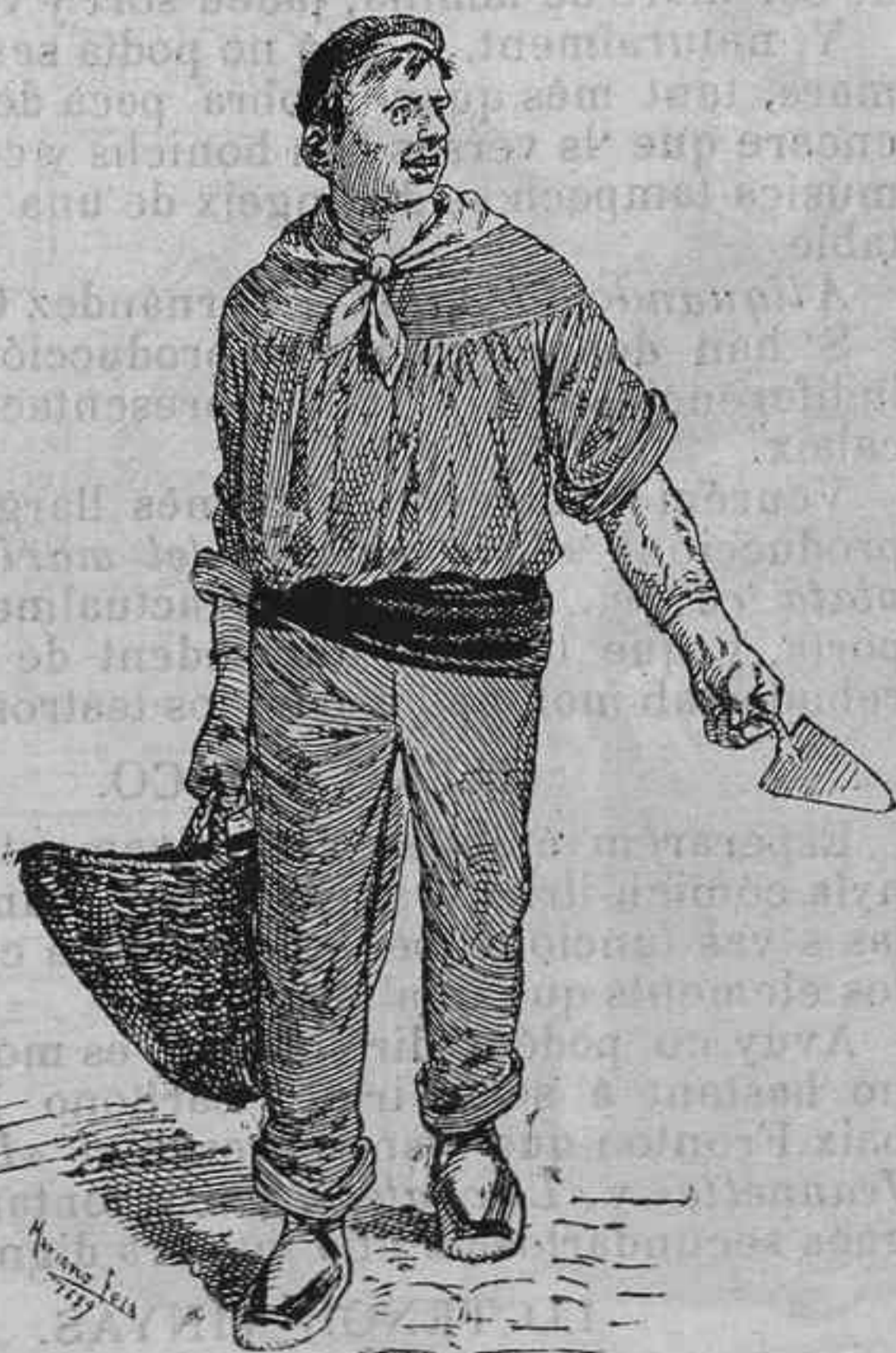
—Gracias á Dèu que s'ha acabat alló de la campana!