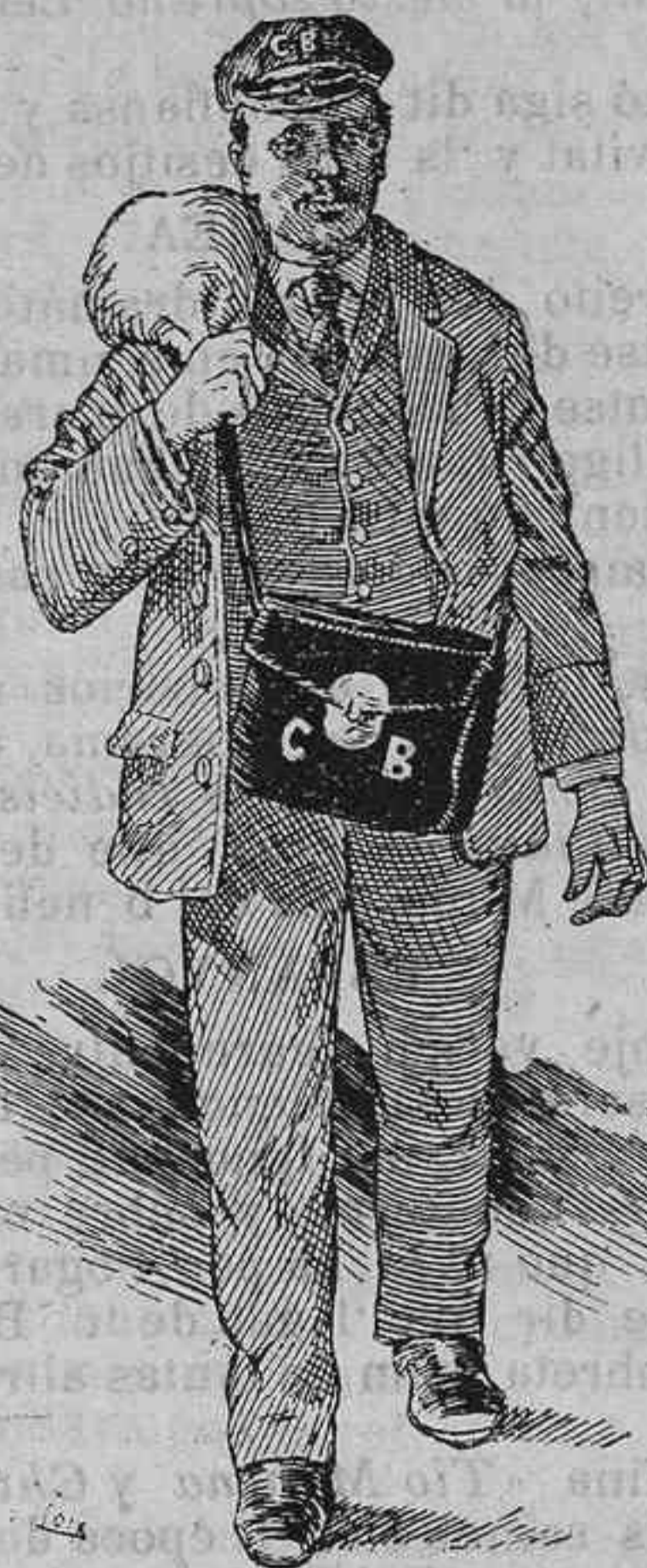
—Després dirán que no hi ha diners! Prou que n'hi ha... sinó que tots van á parar al Banch.