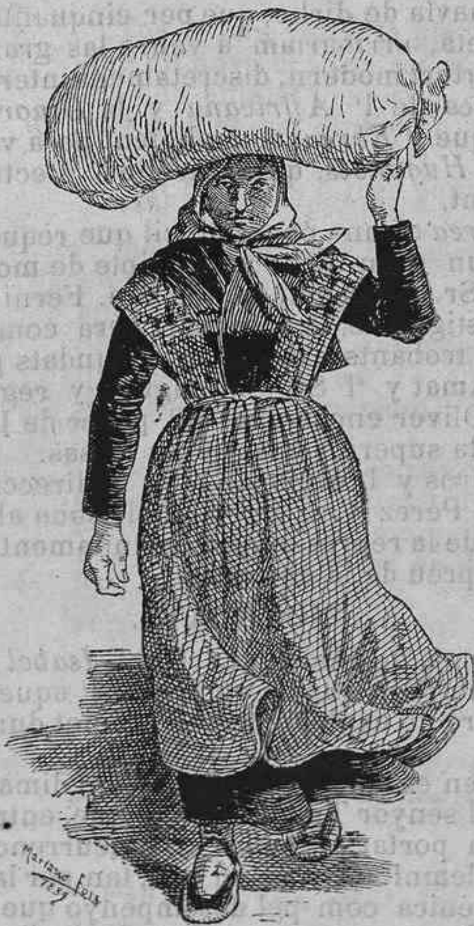
—Cada dia tinch menos camisas á rentar! Potser si que serà veritat aixó de que l'govern deixa á gent sense camisa...