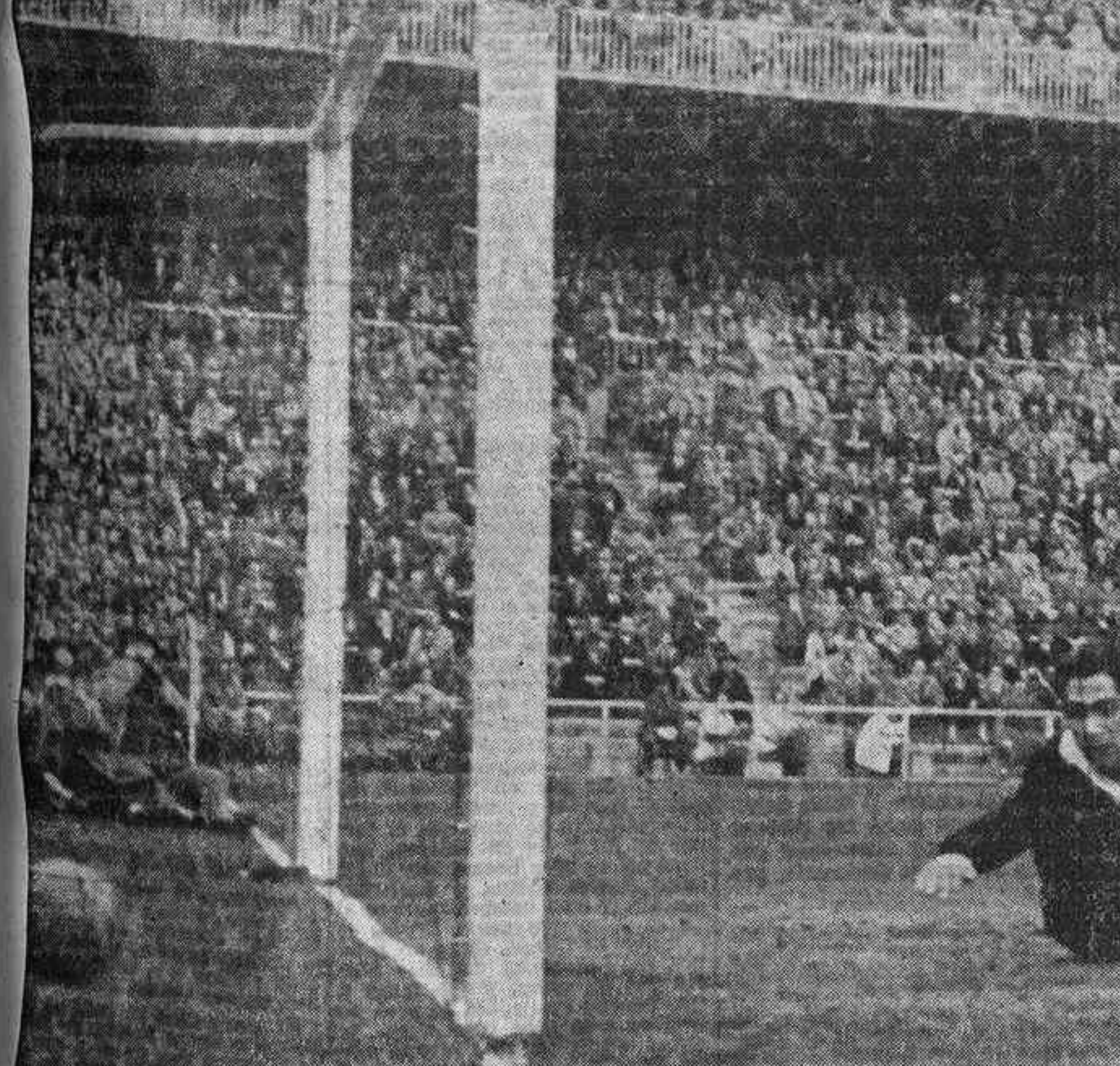
Este fue el primer gol helvético, a los seis minutos del partido. Un disparo por bajo que no logró anular el indiscutible esfuerzo de Ramallets.