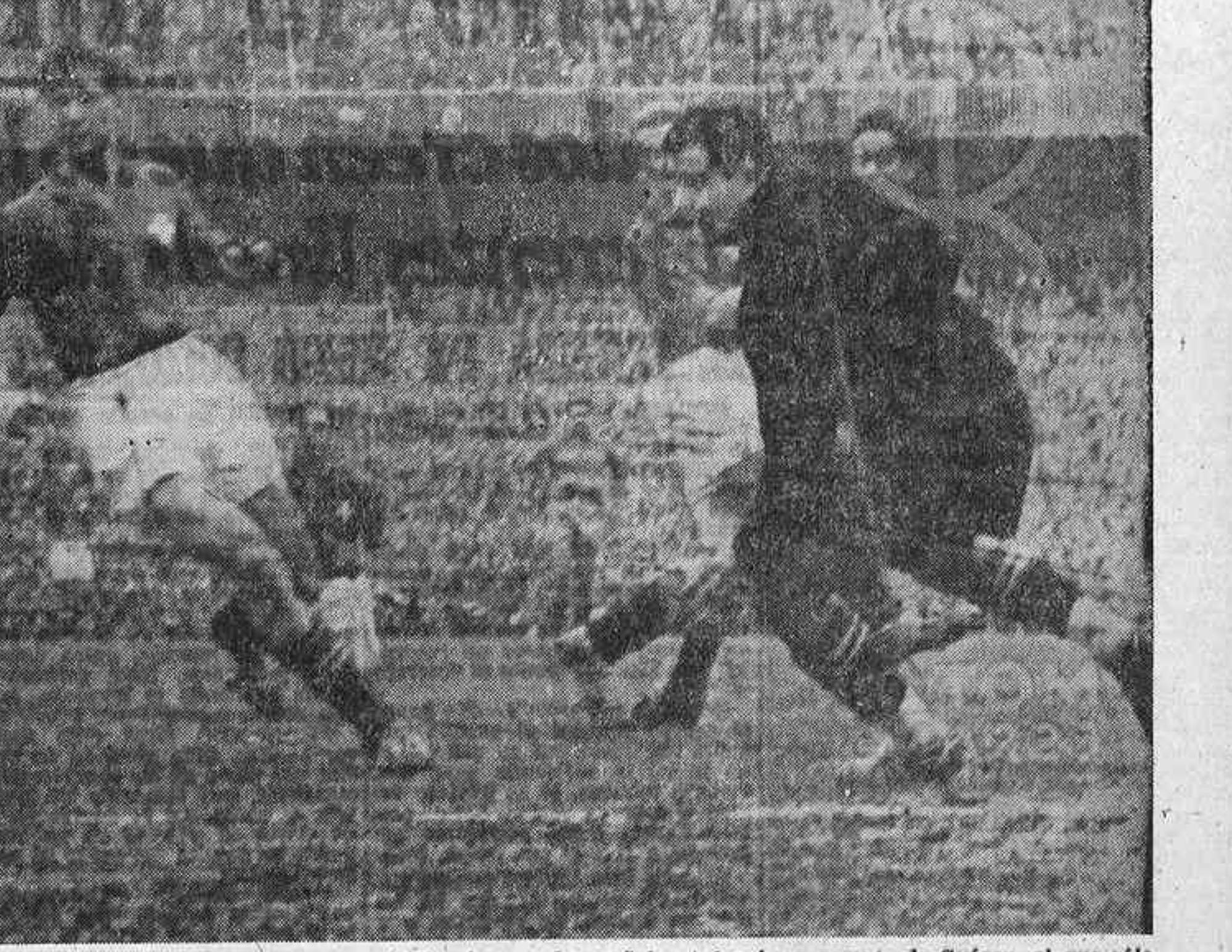
El primer gol español entró así, en remate de Suárez, al que sólo se le ve la cabeza. Un disparo que rebotó en un poste y terminó llegando al fondo.