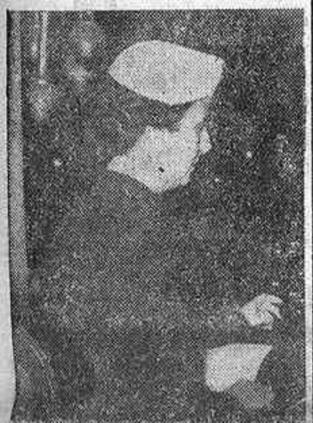
Doña Carmen Polo de Franco patrocinó y realizó con su presencia la función celebrada ayer en el teatro Calderón pro Campaña de Navidad en beneficio de los pobres de Madrid. He aquí a la ilustre dama presidiendo la función desde un palco

Se calcula que llegará al millón lo recaudado para la Navidad de los pobres