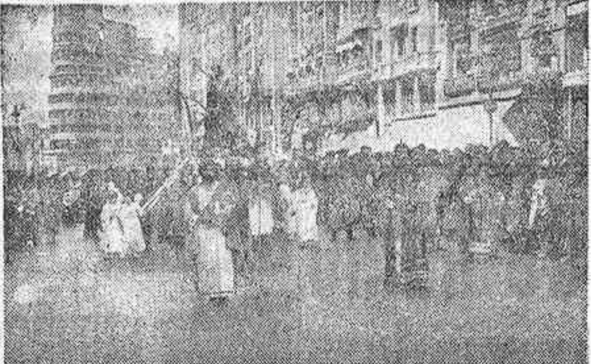
En este grabado se recoge el paso por la Gran Vía de la procesión infantil de las Palmas, que ayer salió del templo de las Descalzas Reales para recorrer diversas calles madrileñas.

Indicaciones: Dolor de estómago, acidez, dispepsia, vómitos, diarreas en niños y adultos, claudicación y dolor de estómago; tonifica y ayuda a las digestiones.