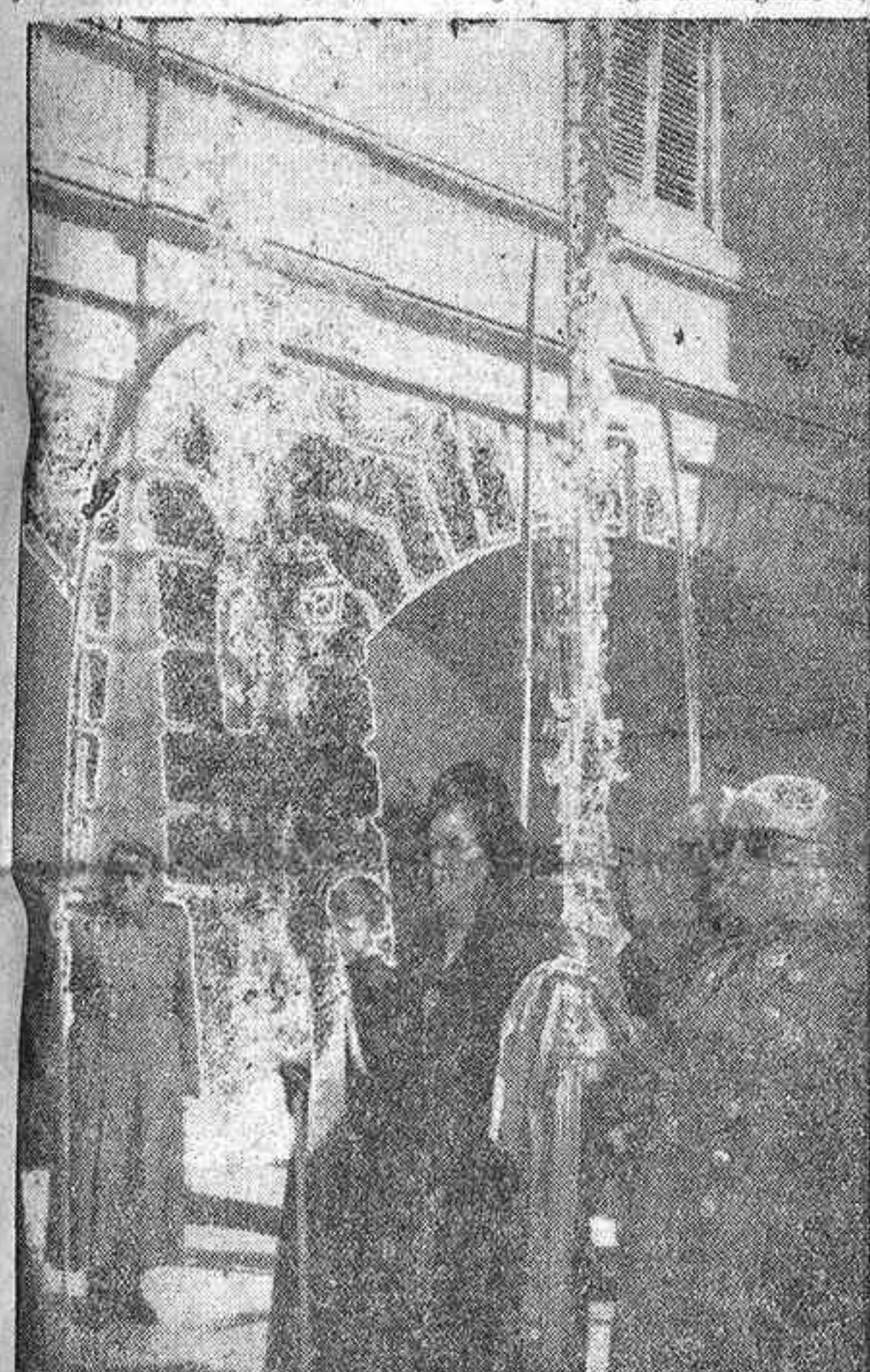
Su Excelencia el Jefe del Estado, acompañado por su esposa, con las tradicionales palmas, preside la solemne procesión del Domingo de Ramos en el palacio de El Pardo.

ras de la Pasión precedían el paso de la "Entrada de Jesús en Jerusalén", al que seguían los Cruzados de la Fe, que presidían la procesión. Cerraba el cortejo, al que se sumaron centenares de niños y de personas mayores llevando palmas, la banda del Colegio de San Fernando. Entre un público numerosísimo, la procesión subió por la calle del Postigo de San Martín a la plaza del Callao, y por la Gran Vía se dirigió al Colegio del Sagrado Co-