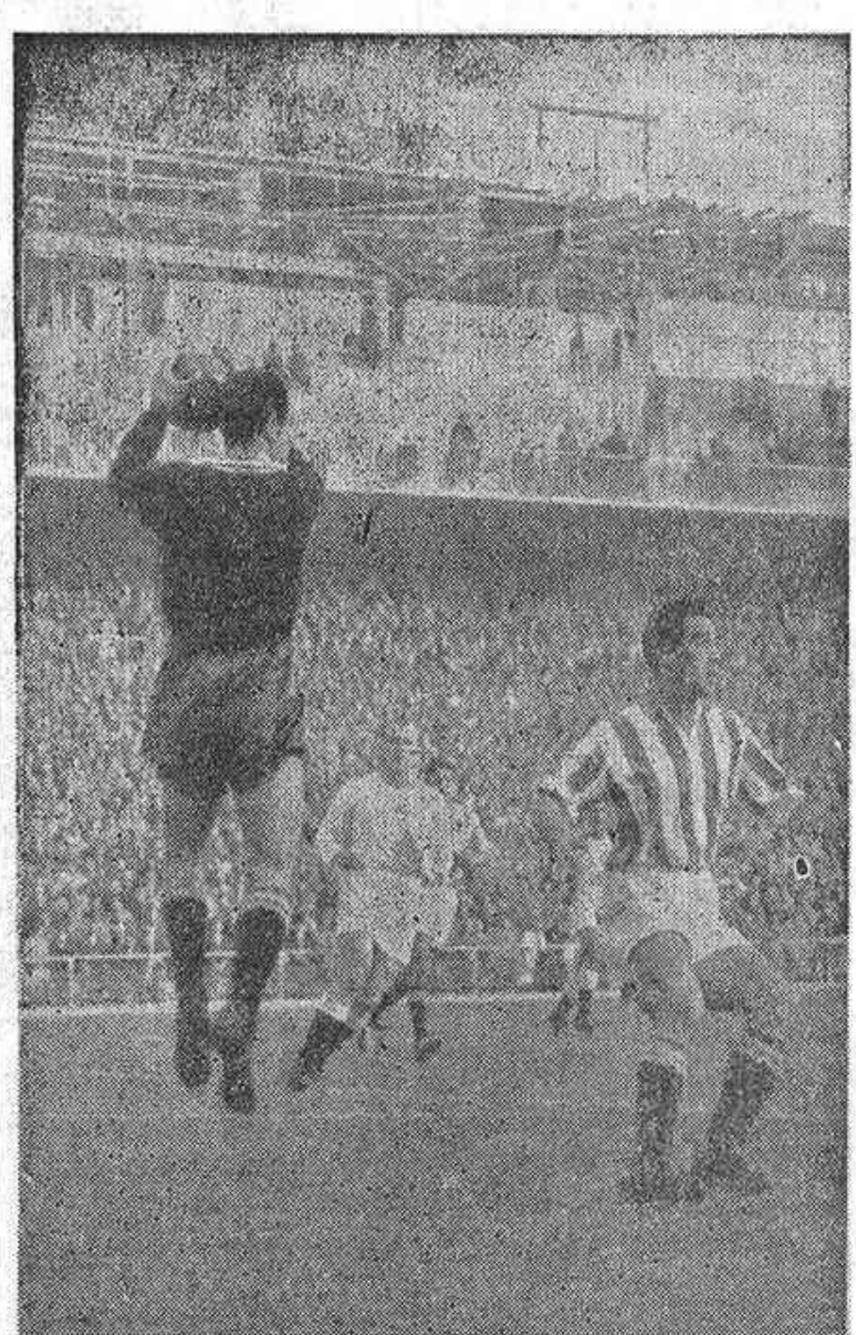
Se registró ayer una sorpresa en Chamartín al empatar a un tanto el Real Madrid, primer clasificado de la Liga, con la Real Sociedad de San Sebastián. La áspere y cerrada acción defensiva de los donostiarres fué la principal causa de este empate. El portero Bagur bloca con estilo una pelota, mientras Olsen sigue con atención la jugada.