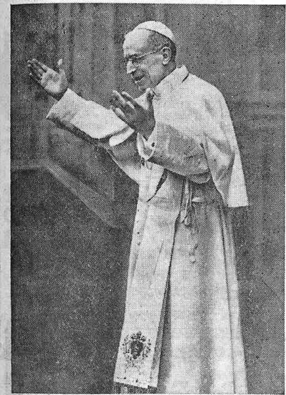
Su Santidad el Papa Pío XII, que ha dirigido un mensaje al pueblo español con motivo de la solemne clausura de la Misión general Nervión, celebrada en Bilbao

RECUERDA EL PADRE SANTO A LOS NAVEGANTES QUE EN PENDONES Y PROAS LLEVABAN ESCRITO EL NOMBRE DE BEGOÑA