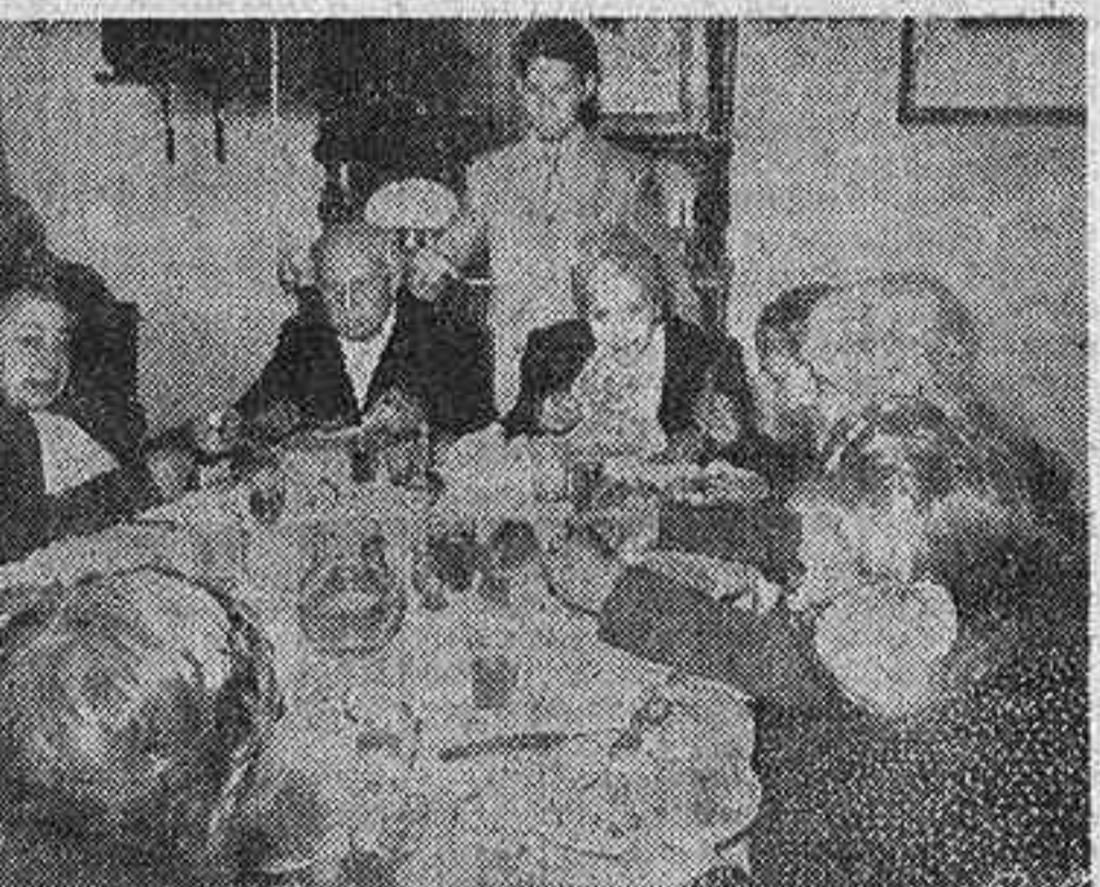
Cuadro familiar a la hora de la comida en el Instituto Cervantes