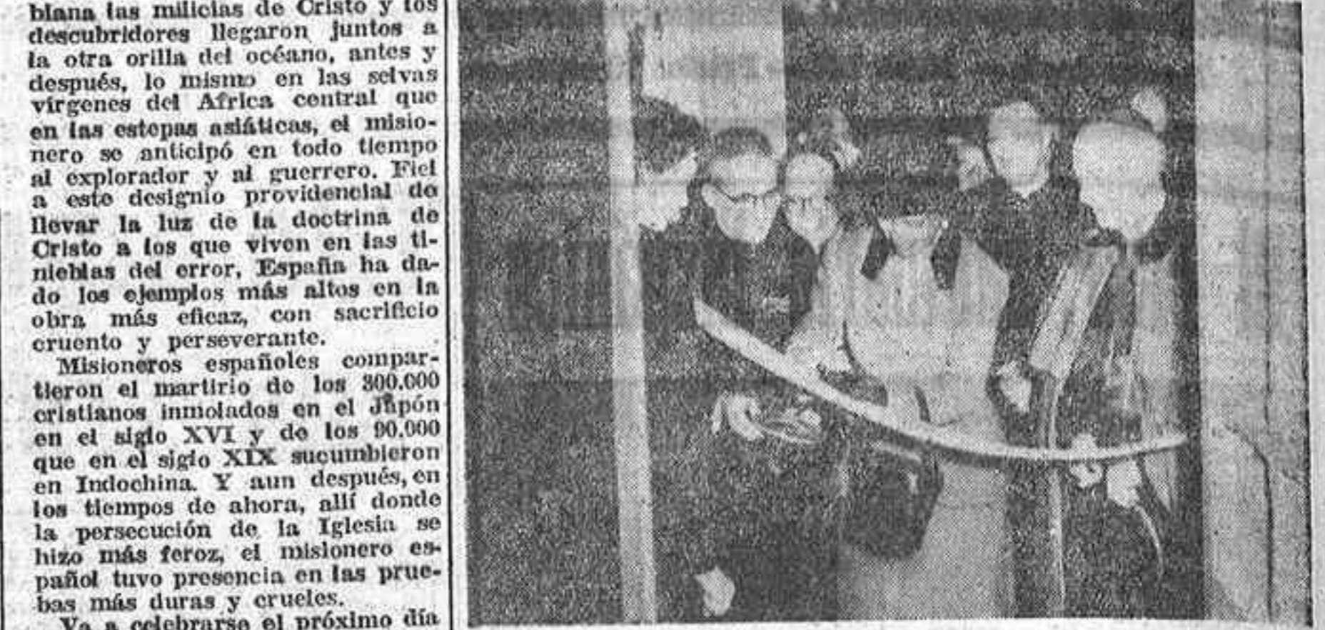
Doña Carmen Polo de Franco en el momento de cortar la cinta que cerraba la entrada a la Exposición.

Asistió al acto el ministro de Industria y bendijo la instalación del patriarca-obispo