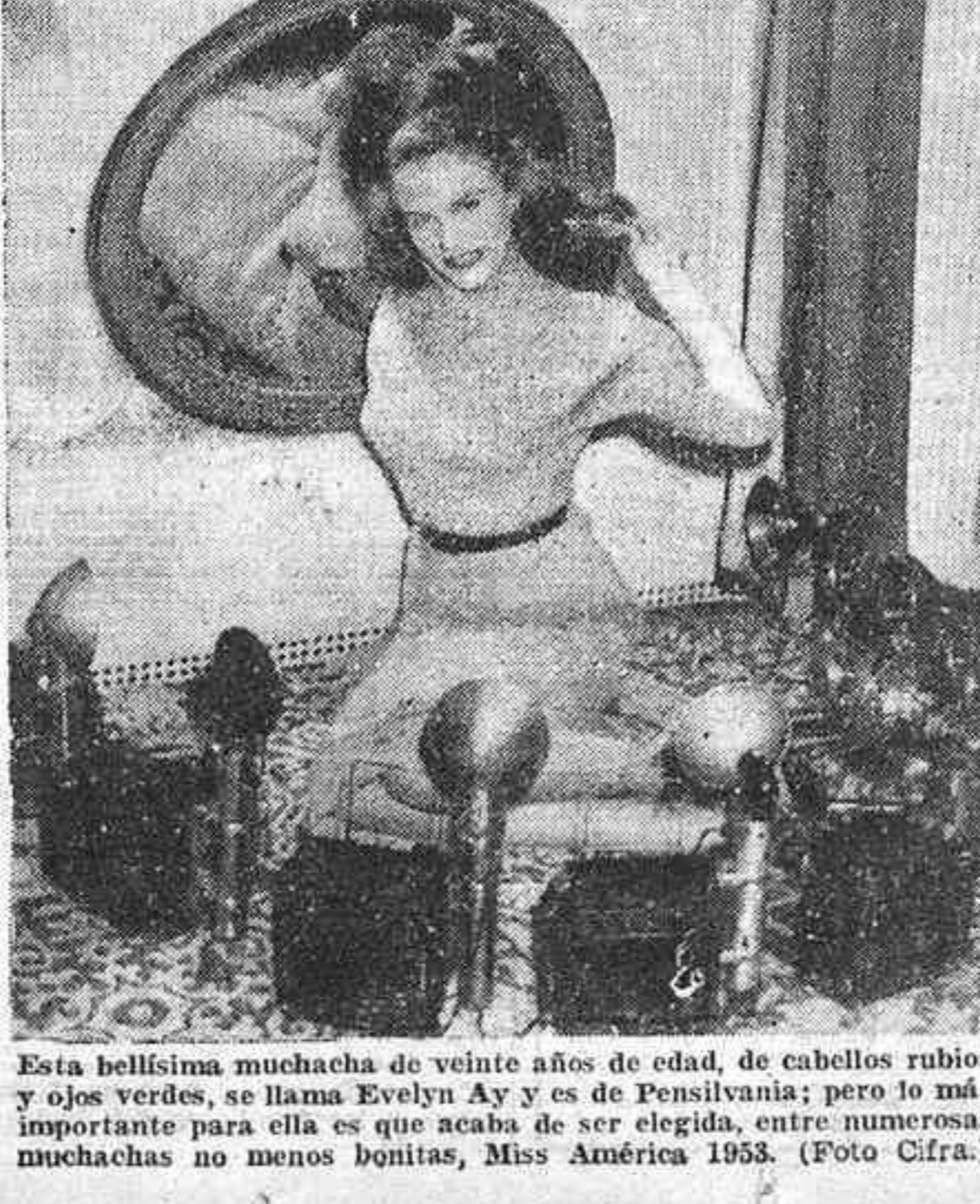
Esta hermosa muchacha de veinte años de edad, de cabellos rubios y ojos verdes, se llama Evelyn Ay y es de Pensilvania; pero lo más importante para ella es que acaba de ser elegida, entre numerosas muchachas no menos bonitas, Miss America 1953.