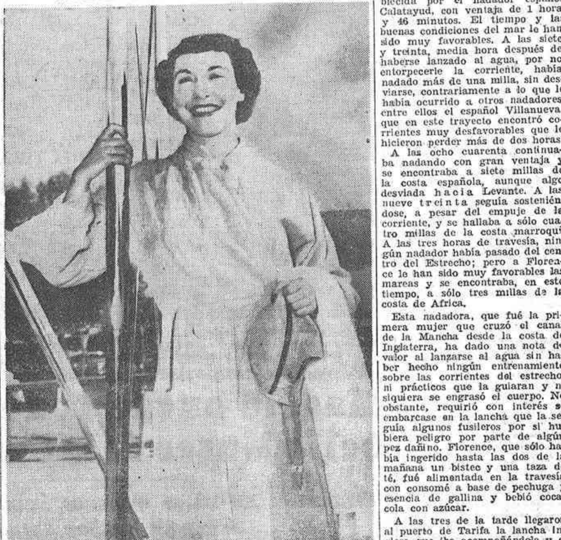
La nadadora norteamericana Florence Chadwick, que en la mañana del domingo cruzó a nado el estrecho de Gibraltar después de magnífica proeza, superando la marca de la prueba que poseía el español Calatayud.

ATRAVESO EL ESTRECHO DE GIBRALTAR Y BATIO HOLGADAMENTE EL RECORD DE LA PRUEBA