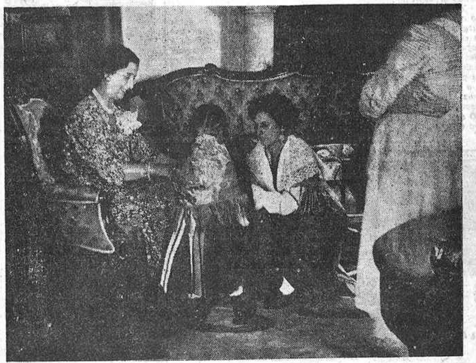
Durante la reciente estancia del jefe del Estado en su residencia veraniega de las Torres de Meirás, el coro Cantigas da Terra regaló a las dos hijas de los marqueses de Villaverde sendos trajes de típico estilo regional, como íntimo homenaje de acendrado afecto. En el fotografiado, doña Carmen Polo de Franco cibe el mantoncillo marraño a la menor de sus nietas, ayudada por una señorita del popular coro coruñés.