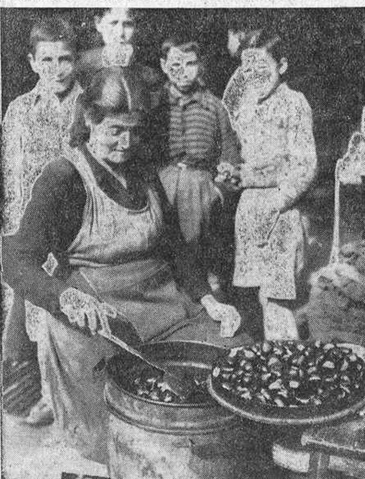
Para los niños es singular la tentación de la castañera. Basta mirarlos a la cara a los cuatro alineados ante el anafre para comprender de qué buena gana agotarían las existencias del puesto.

Aunque el veranillo de San Miguel se presente hogaño de manera que nos haga pensar si errará el calendario y estemos en agosto todavía, no hay que fiarse mucho ni poco. Bien pudiera ser que antes de quince días—pongamos por plazo largo—comenzase a soplar el "aire sutil que mata a un hombre y no apaga un candil", y oyésemos de esquina a esquina el pregón de: «¡Cuántas, cuántas! ¡Calentitas!». Pues se agrían ya los erizos en el veranillo de las arañas a las voladoras y ya la castañera llama a las puertas del otoño con los nudillos de sus manos reengredidas por el contacto del anafre. Manos desafiadoras del cerco que cogen a puñados el calor para ponerlo en nuestras manos como panita de Samartiana la frescura del agua en el labio del sedente. El que va o vuelve del quehacer cotidiano, a sus prisas o a sus ocios, bajo la lluvia o bajo la nieve o azotado por el viento que vuela en las calles al frío de los ventisqueros de la mañana, alivia la inclemencia del tiempo con esa calefacción personal y transportable que le propone la mujerica arrojada junto al hornillo chispeante y resaltante. Sibaritismo de los humildes, que no desdena quien conoce los refinamientos del abrigo de pieles, la comodidad del auto bajo techo y las elegancias del "marrón glaseo".