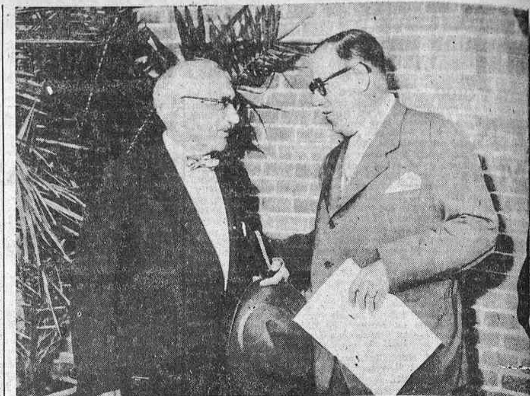
El presidente de la Compañía Española de Penicilina felicita al profesor Waksman al ser descubridor de la lámpara en su honor.

El presidente de Merck. Terminada la detenida visita, las ilustres personalidades que asistieron al acto fueron obsequiadas con un almuerzo.