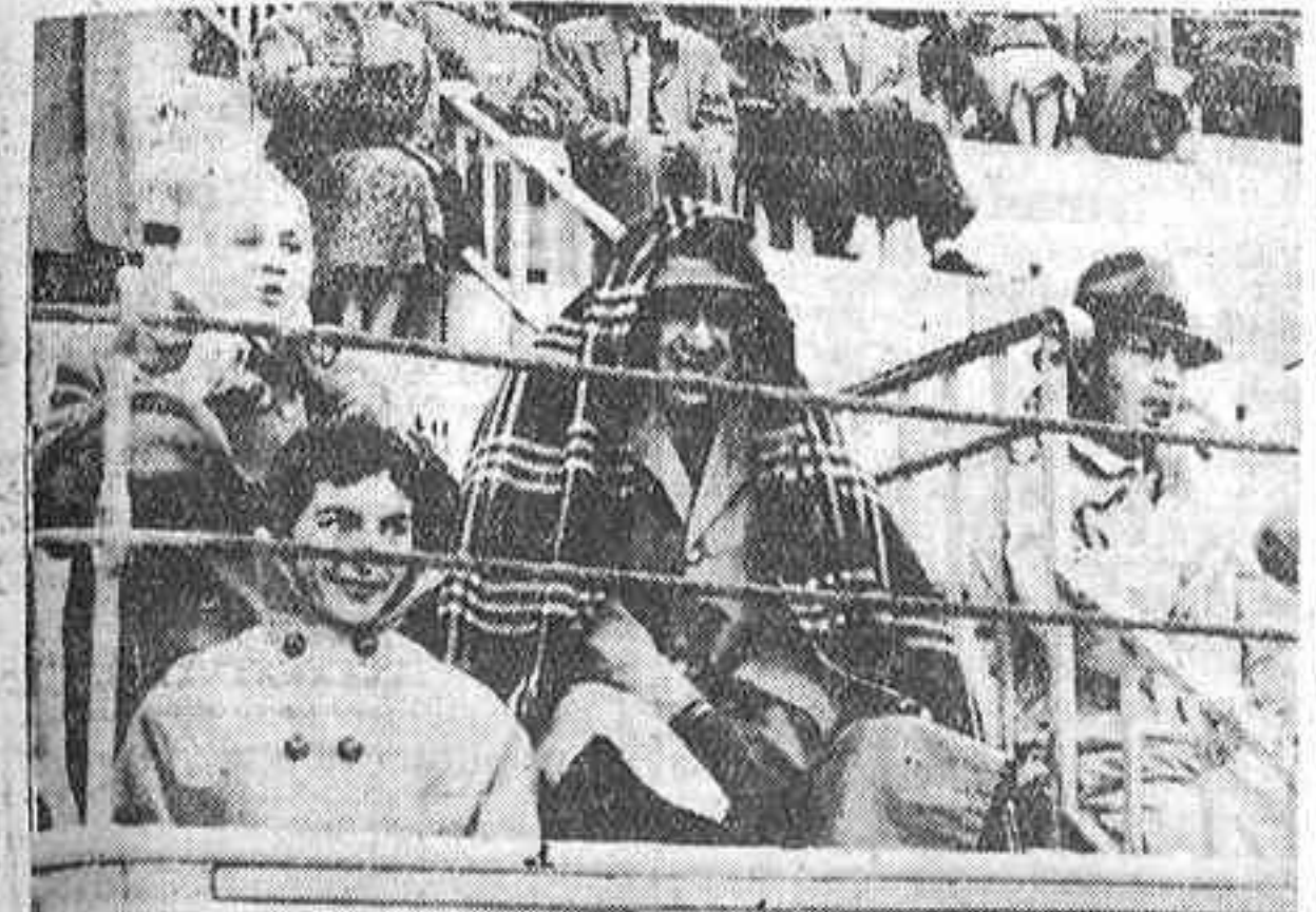
Mucho frío ayer, muchísimo, y con un viento molestísimo para toreros y espectadores, en la plaza de las Ventas, en la que se celebraba la tradicional corrida de inauguración oficial de la temporada. Así vemos a este espectador — y no fué el único — que aprovechó la manta del coche para resguardarse del azote del viento serrano, del que también procura resguardarse como puede con un pañuelo su sonriente acompañante.