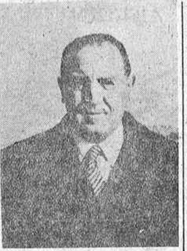
Don Santiago Bernabéu, presidente del Real Madrid, bajo cuyo feliz mandato han sido logrados tres difíciles objetivos: la construcción del gran estadio que va a llevar su nombre, la incorporación al equipo del famoso jugador Di Stéfano y, por último, la obtención del campeonato de España de Liga

Cursada por la Peña Mariano, y con el nombre de esta entidad, el club campeón de Liga, recibimos la siguiente carta: "Señor director de HOJA DEL LUNES. Plaza del Collao, 4. Madrid. Muy señor nuestro: Los que suscriben en nombre de las peñas madridistas, así como en el de los socios veteranos, se dirigen a usted con la súplica de que publique las siguientes líneas.