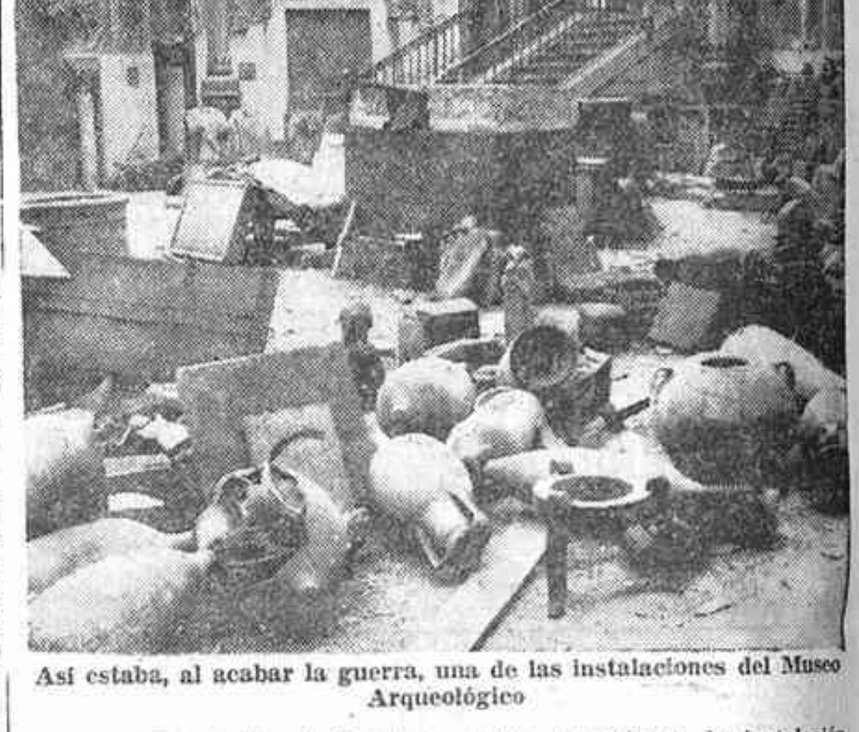
Así estaba, al acabar la guerra, una de las instalaciones del Museo Arqueológico