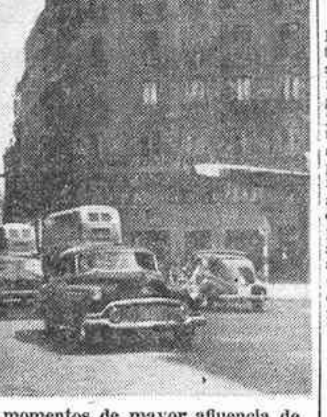
Así es la Gran Vía, y no en los momentos de mayor afluencia de vehículos. La ancha avenida parece empujada por los autobuses...