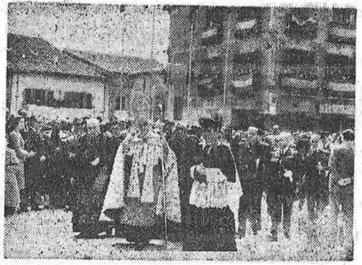
El patriarca de las Indias Occidentales y obispo de Madrid-Alcalá, doctor Eijo Garay, procede a la bendición de la cruz-monumento que en memoria del glorioso cardenal Jiménez de Cisneros fue ayer inaugurada en Torrelaguna, su pueblo natal.

Fue ayer inaugurado para reemplazar al que destruyó la barbarie roja