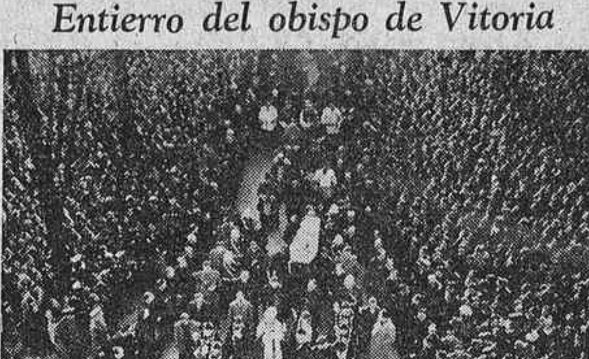
Entierro del obispo de Vitoria. Una importante muchedumbre—toda la ciudad—se ha sumado al entierro, verificado en Vitoria, del obispo de la diócesis y arzobispo preconizado de Santiago, doctor don Carmelo Ballester. He aquí el fénebre portaje a su lidada a la catedral, donde los restos del prelado recibieron sepultura.