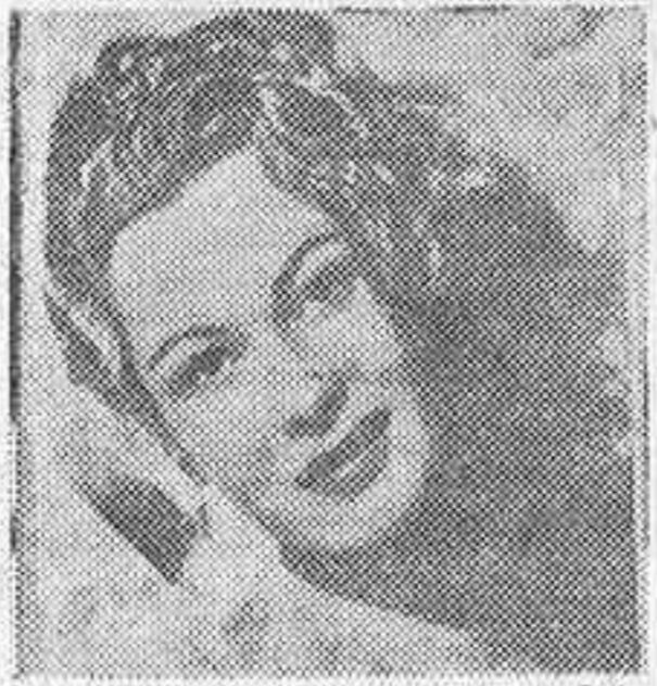
Blanquita Amaro, famosa vedette, que además de poseer una extraordinaria belleza y singulares dotes artísticas, está considerada como la mejor "rumbera" del mundo.

Una vez más surge a vanguardia de la actualidad espectacular madrileña el nombre, mercedemente afamado, de "Pasapoga". Dias pasados, uno de nuestros colegas de la tarde recogía en su sección teatral la llegada a Madrid de la famosa "vedette" cubana Blanquita Amaro, contratada por la gerencia del conocido salón de té. Desde entonces hay que reconocer que es extraordinaria la expectación que