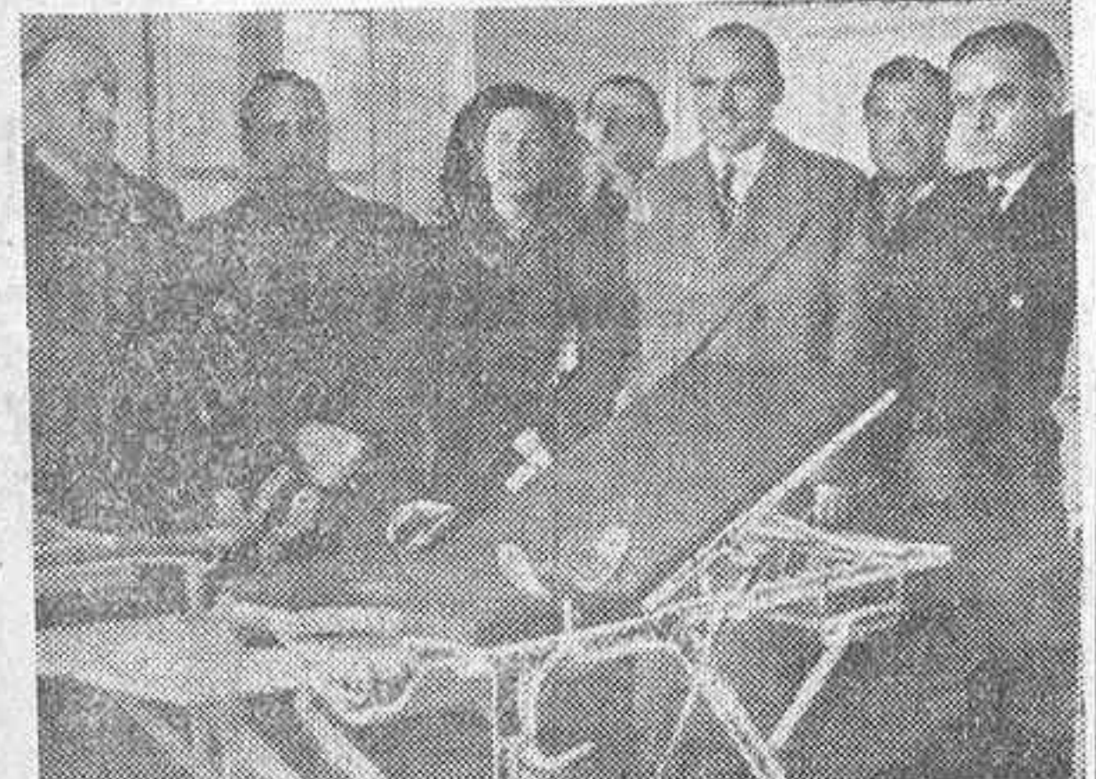
El presidente de la Diputación de Madrid, marqués de la Valdeavía, hace entrega a las autoridades de San Sebastián de los Reyes del centro sanitario que en la mañana de ayer fué inaugurado en dicha localidad.

SE EFECTUO, POR EL PRESIDENTE DE LA DIPUTACION, EN SAN SEBASTIAN DE LOS REYES Y EN EL MOLAR