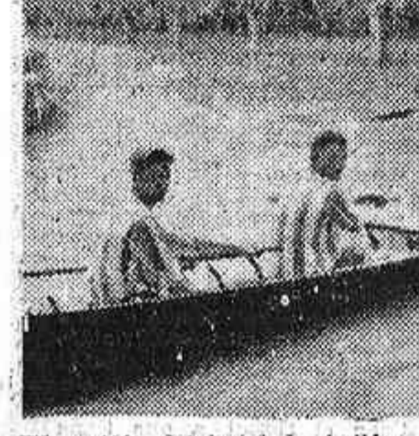
El capitán del batel de Avilés, ganador de la Copa de San Isidro en las regatas celebradas ayer por la mañana en el estanque del Retiro, muestra a la multitud el trofeo conquistado.