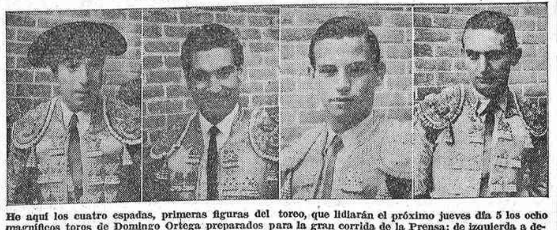
He aquí los cuatro espadas, primeras figuras del toreo, que lidiarán el próximo jueves día 5 los ocho magníficos toros de Domingo Ortega preparados para la gran corrida de la Prensa: de izquierda a derecha, Pepe Luis Vázquez, Antonio Bienvenida, Manolo González y José María Martorell.

CUATRO GRANDES FIGURAS DEL TOREO CON OCHO TOROS DE LA MEJOR CASTA