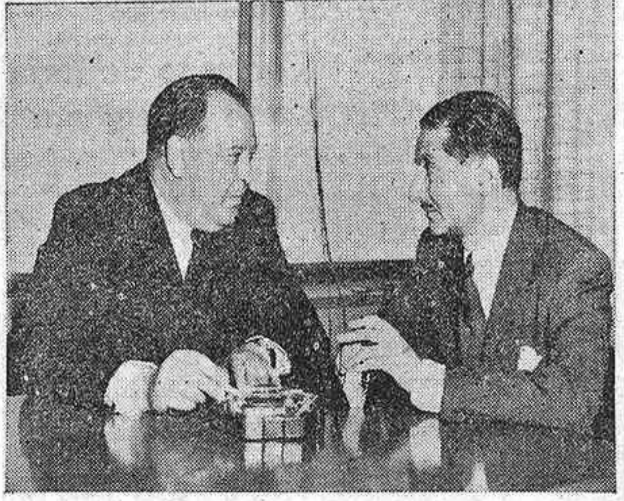
El secretario general de la O. N. U., Trygve Lie— a la izquierda de la foto—, apenas llegado a Nueva York de las vacaciones que pasaba en su país noruego, ha celebrado una conferencia con el presidente de la Asamblea General y embajador de Persia en los Estados Unidos, Nasrollah Entezam, para tratar de la propuesta de "alto el fuego" en Corea, hecha por Jakob Malik, delegado de la Unión Soviética en las Naciones Unidas.