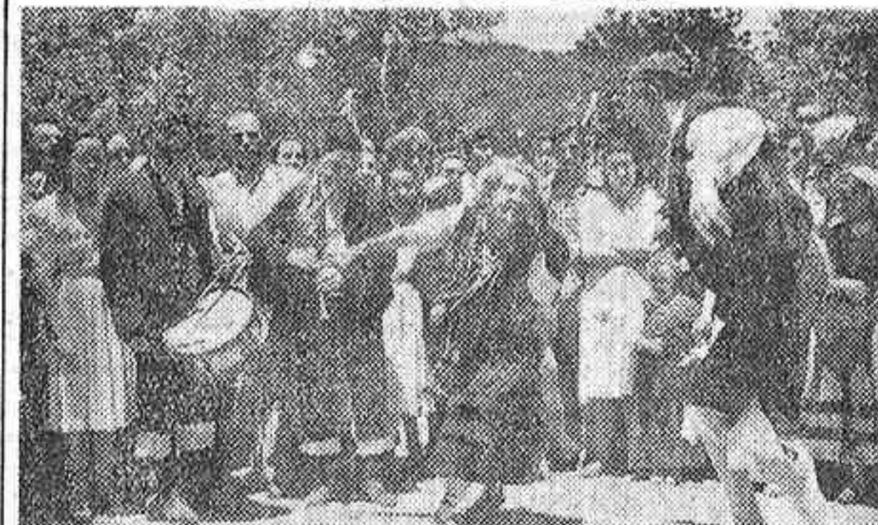
En la Casa de Campo se celebró ayer una romería asturiana, en la que no podían faltar, al son de la gaita y el tamboril, los bailes regionales, uno de cuyos animados pasos se recoge en esta foto

Miles de asturianos, puede decirse que casi la totalidad de los residentes en Madrid, se reunieron ayer en la Casa de Campo, en el lugar conocido por el pinar de las Siete Hermanas, para dedicar un homenaje a Nuestra Señora de Covadonga.