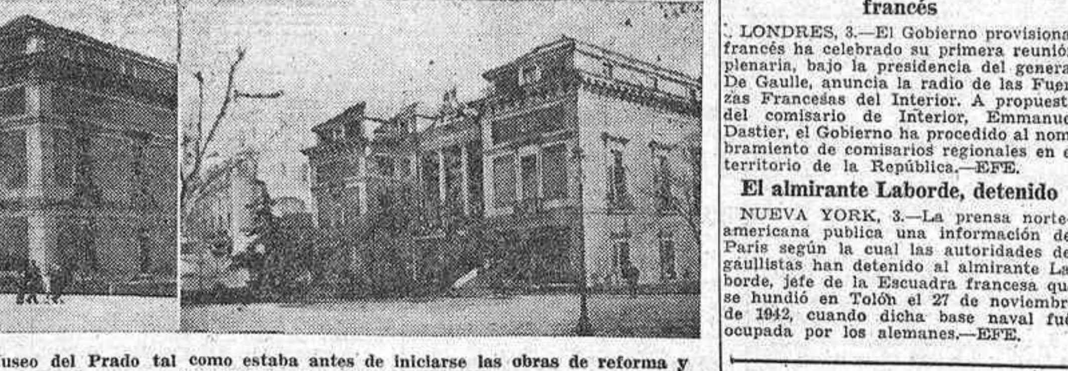
He aquí la fachada principal del Museo del Prado tal como estaba antes de iniciarse las obras de reforma y tal como quedará una vez terminadas.

LAS OBRAS, POR UN PRESUPUESTO DE 300.000 PESETAS, QUEDARÁN TERMINADAS EN EL PROXIMO INVIERNO CON LA REFORMA, EL PUBLICO TENDRA ACCESO DIRECTO DESDE EL NIVEL DE LA CALLE A LA ROTONDA DE CARLOS V