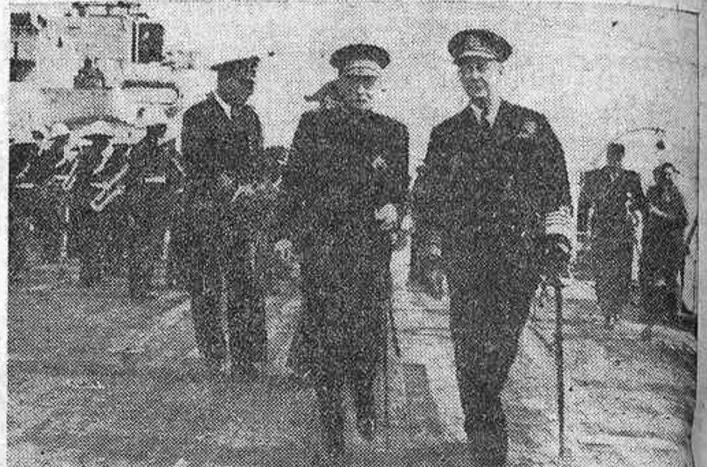
Durante la estada en el Tajo de una división de la Home Fleet británica, el Jefe del Estado portugués, general Carmona, efectuó una visita al acorazado "Nelson", donde fué recibido por el almirante Syfret, jefe de aquella flota.