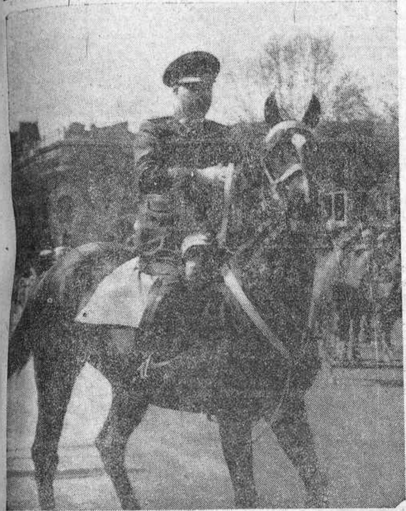
El Generalísimo en jefe del Estado revisando a sus tropas, a caballo, en el Día de la Victoria de hace un año.

Un gran desfile de tropas soviéticas en Madrid