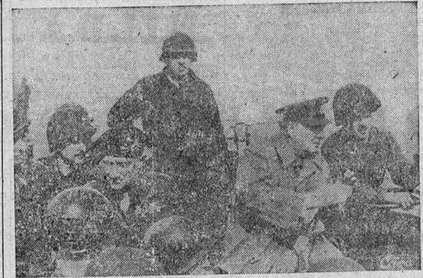
El jefe del Gobierno británico, Winston Churchill, acompañado del comandante del XXI grupo de ejércitos, Winston Montgomery...

En las orillas del Ems, donde Holanda está amenazada de envolvimiento, se hace la resistencia más encarnizada