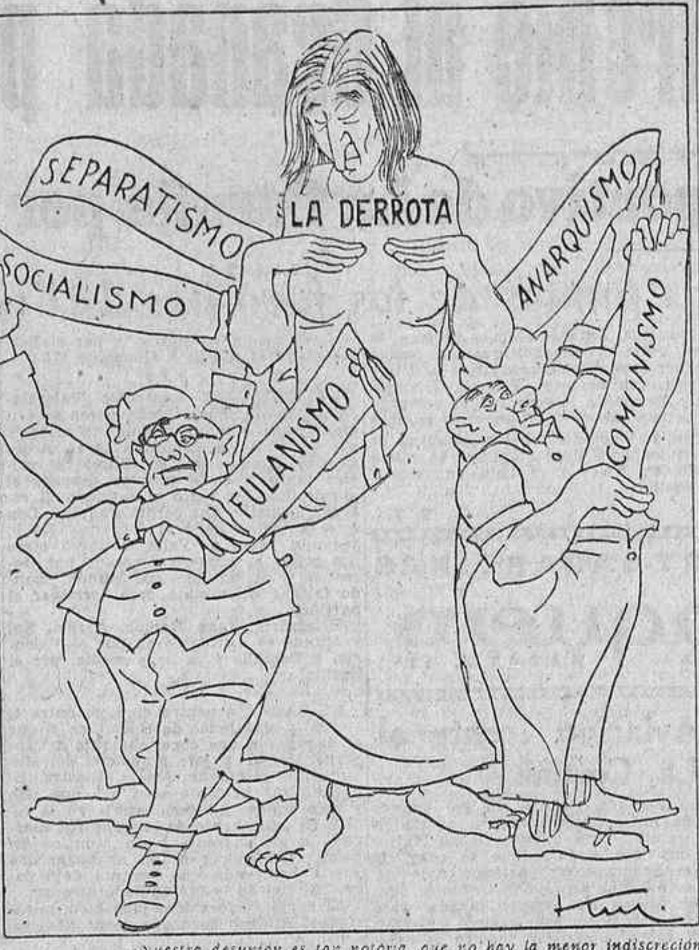
Nuestra desgracia es tan notoria, que no hay la menor indiscreción en proclamarla. (De un artículo de Ossorio y Gallardo en 'Ahoras', de Buenos Aires.)