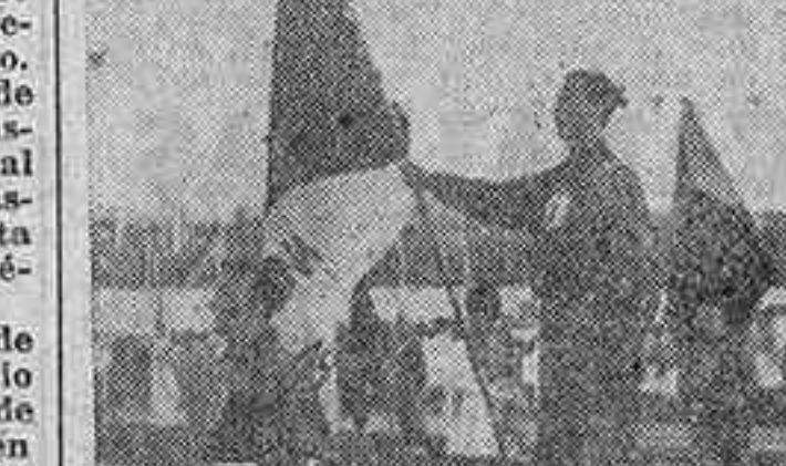
En el estado de la Ciudad Universitaria se celebró ayer tarde la clausura de los II Juegos Universitarios Nacionales...