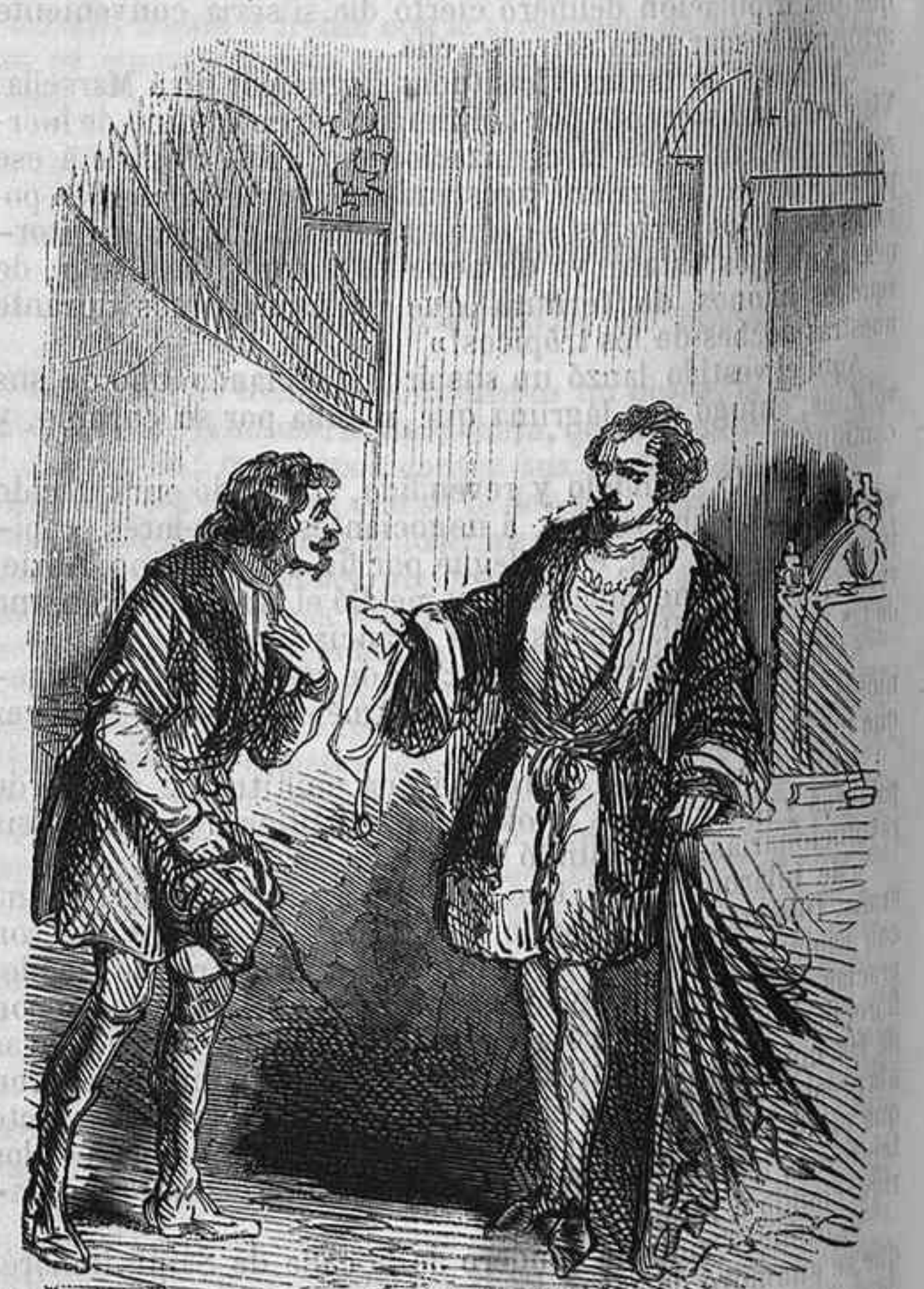
El ladrón de la corte.

brense todos los espacios del cielo; bajan los astros, y las nubes se aplanan y tocan la tierra cubriéndola de tinieblas. La luna, tinta en sangre, se parece á un escudo de hierro, sobre el cual se deposita el cuerpo de un joven esparciado, degollado por el enemigo; rueda y hace pesar sobre mí su disco lívido, que oscurece mas y mas el humo de los apagados fuegos del palacio. Meroe prosigue corriendo y golpeando con sus manos, que despiden relámpagos, las innumerables columnas del salon, entre las cuales aparecen ejércitos de fantasmas: no hay una sola entre todas que no presencie el sacrificio de un niño recién nacido, arrancado á las caricias de su madre. ¡Piedad!... ¡Piedad!... exclamé, para esa madre infortunada que disputa su hijo á la muerte. Pero esta ahogada súplica no llegaba á mis labios, sino con la fuerza del soplo de un agonizante, que dice... ¡Adios! Sí; espiraban en mi boca bal-