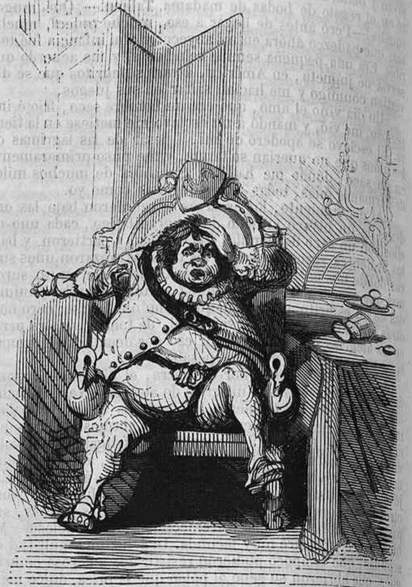
El Cisne de Plata.

pliegues se enroscaban en su desnudo brazo, lo desató y empezó á llamarle con palabras secretas; animada al punto la serpiente, estendió sus brillantes anillos y huyó lanzando horribles silbidos, semejante á un esclavo que recobra su libertad. Al mismo tiempo se abren todas las bóvedas, descé-