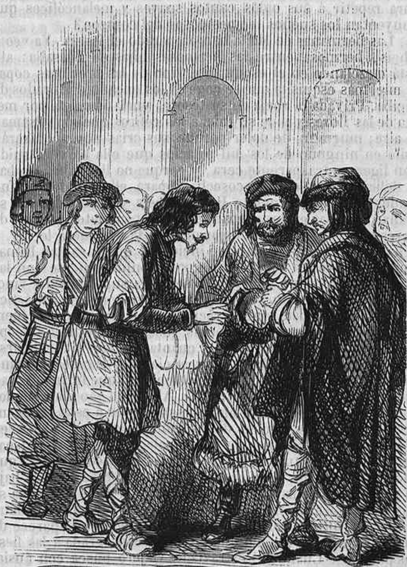
El ladrón de la corte.

Aquí puedes beber, hablar y dormir sin temor, porque los duendes son amigos nuestros: refiere pues, Polemon, los extravagantes dolores que has creído sentir, bajo el imperio de las brujas, porque los tormentos con que abruma á nuestra imaginación, se reducen á las ilusiones de un sueño, mas ó menos pesado, que se desvanece cuando brillan en el horizonte los primeros rayos de la aurora. Theis, Thelaira y