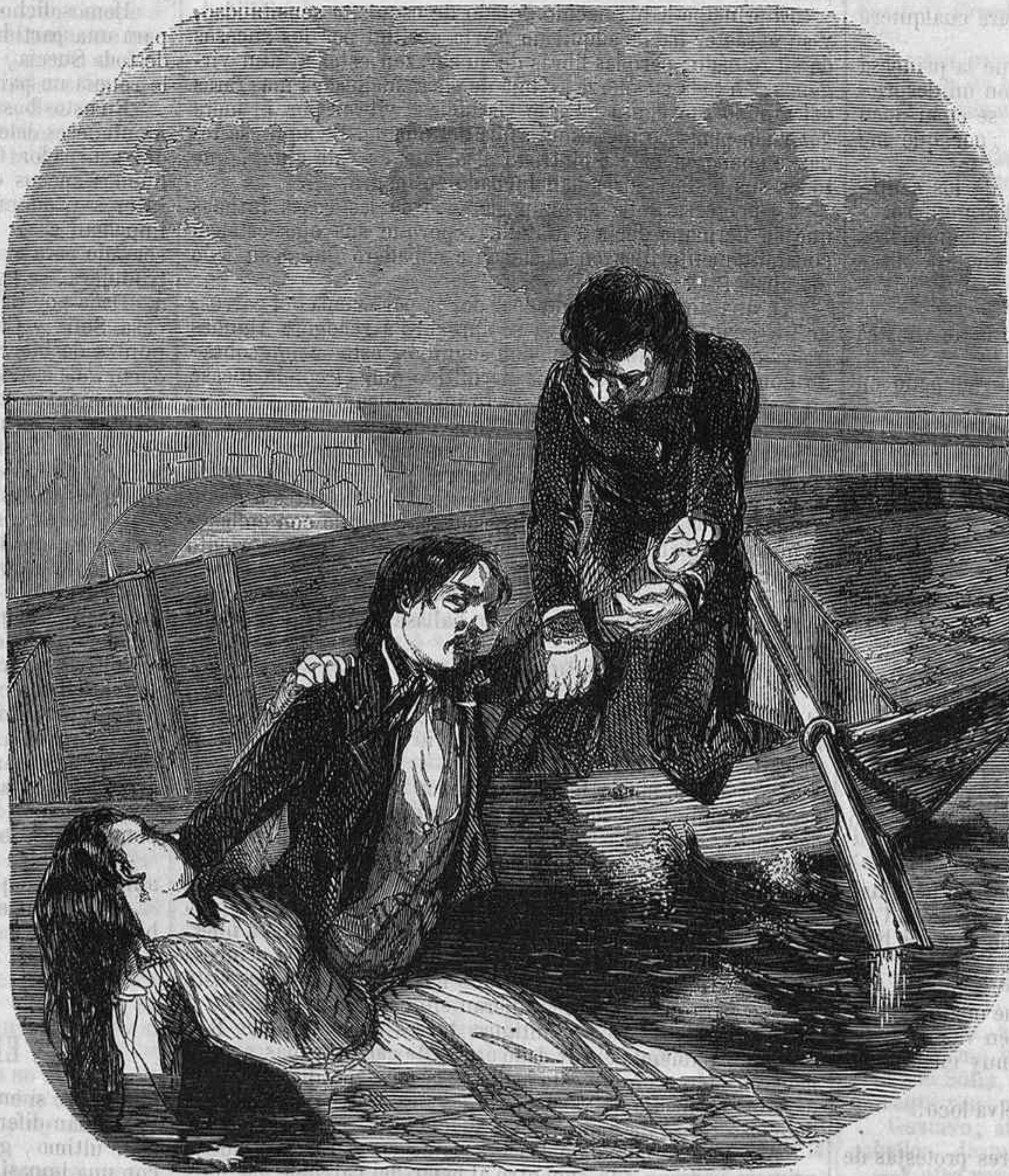
El cochero de cabriolé.

Toda mi vida me acordaré de aquel momento, porque fué horrible para mí: cualquiera hubiera creído que el río era de tinta, pues se veía enteramente negro. Solo de vez en cuando se elevaba alguna ola para arrojar su espuma, y allá... en medio... se distinguían por un instante el vestido blanco de la joven ó la cabeza de mi amo, que subía á la superficie alguna para respirar. Una sola vez aparecieron los dos objetos á un mismo tiempo, y oí que decía Mr. Eugenio: ¡Bueno! Ya la veo. En dos brazadas llego al punto en que un momento antes flotaba el vestido. De allí á un rato vi salir únicamente fuera del agua sus piernas... las apretó con fuerza y desapareció de nue-