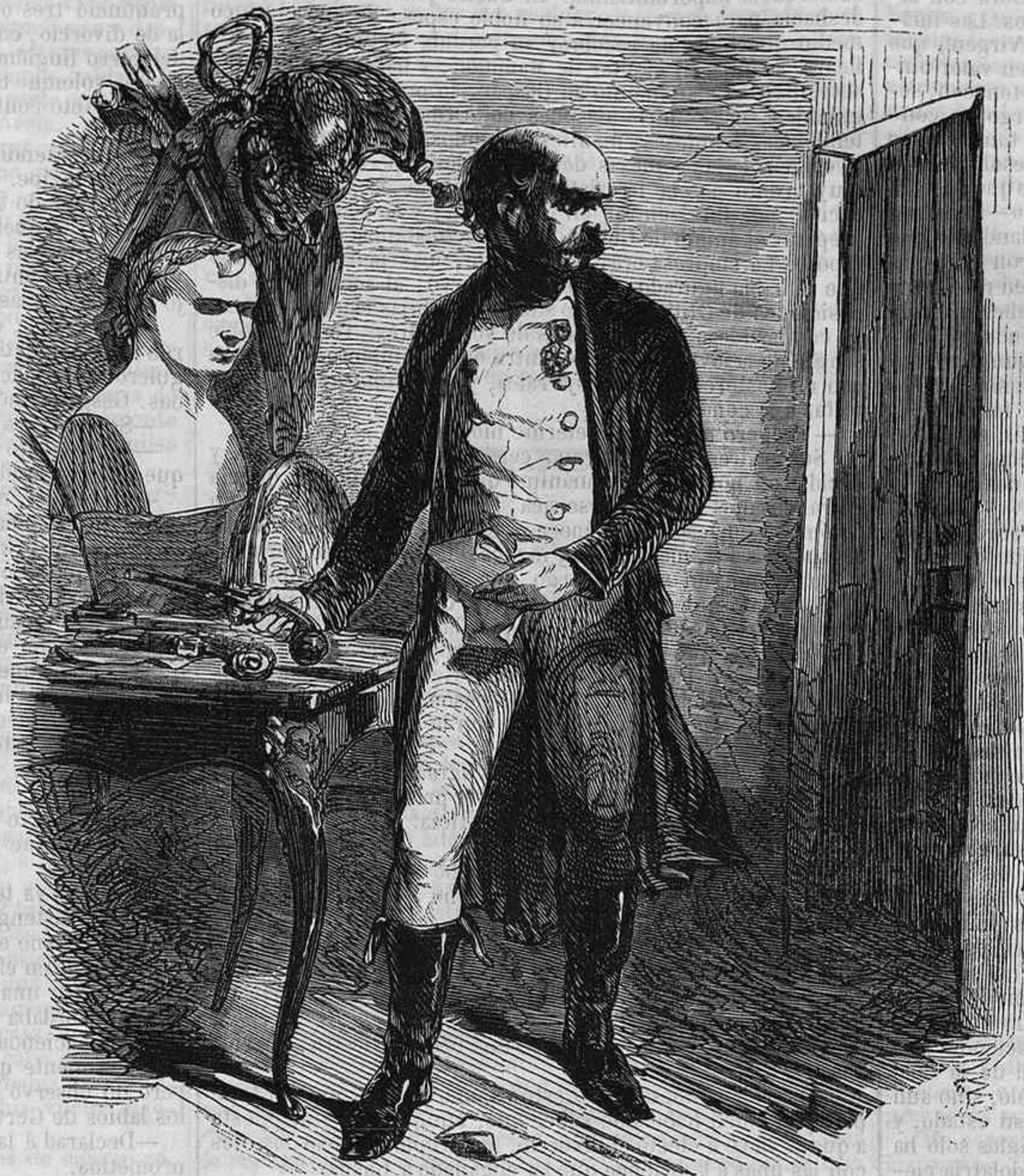
El cochero de cabriolé.

«Aun mas impotente aparece el gobierno chino con respecto á la piratería que se hace impunemente en las costas chinas, sobre todo en el río Canton y en el archipiélago situado á la desembocadura de aquel. Justamente en el verano en que nos hallamos aquí, llegaron las cosas á tal extremo que dos buques mercantes chinos fuéron saqueados de dia en aquel río. Si no hallan resistencia alguna suelen dejar escapar á la embarcacion después de haberla saqueado completamente, sin hacer daño ninguno á la tripulacion; pero si el buque apresado quiere