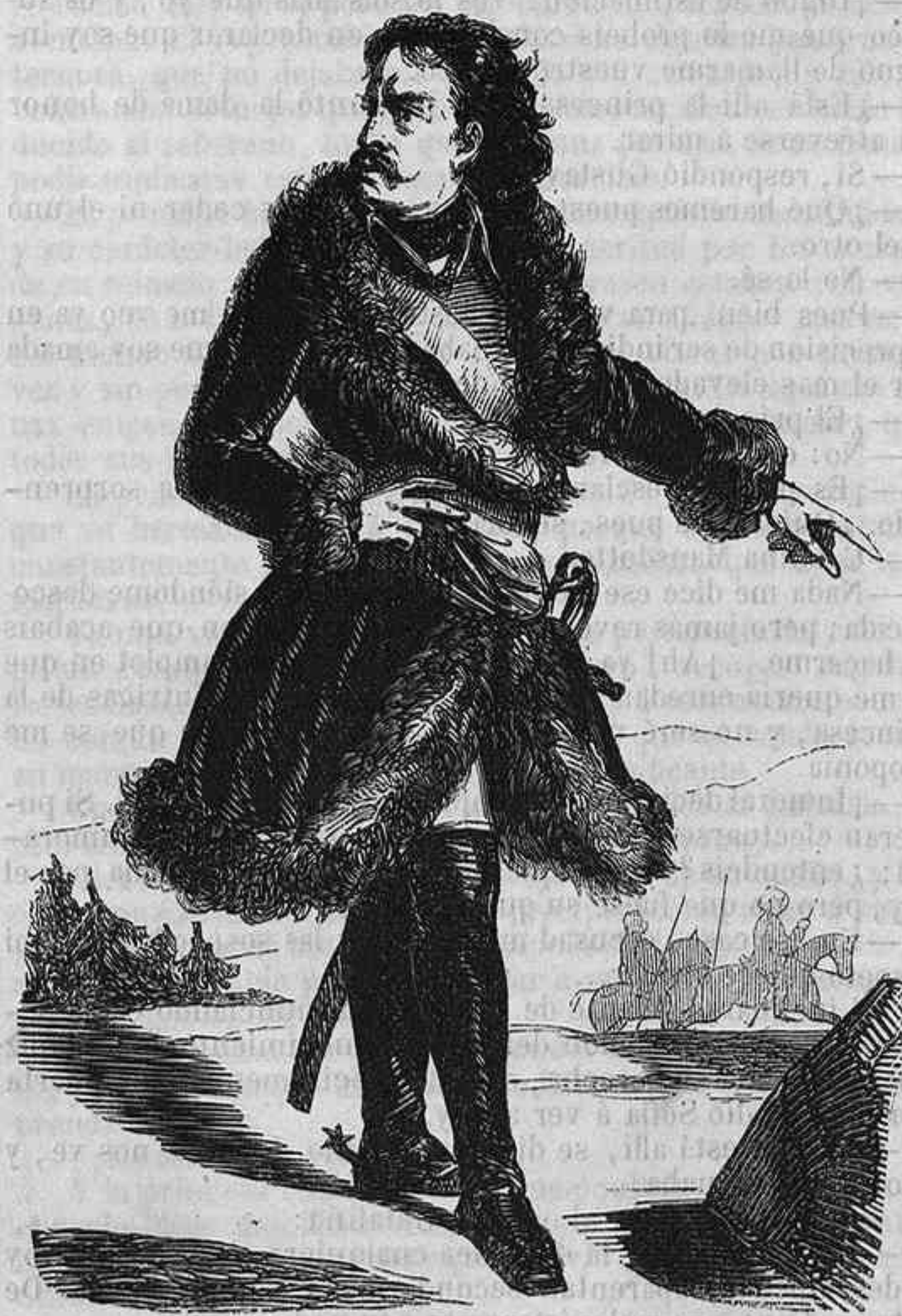
Pedro el Grande.

El caballero D'Eon, agregado dos veces al encargado de