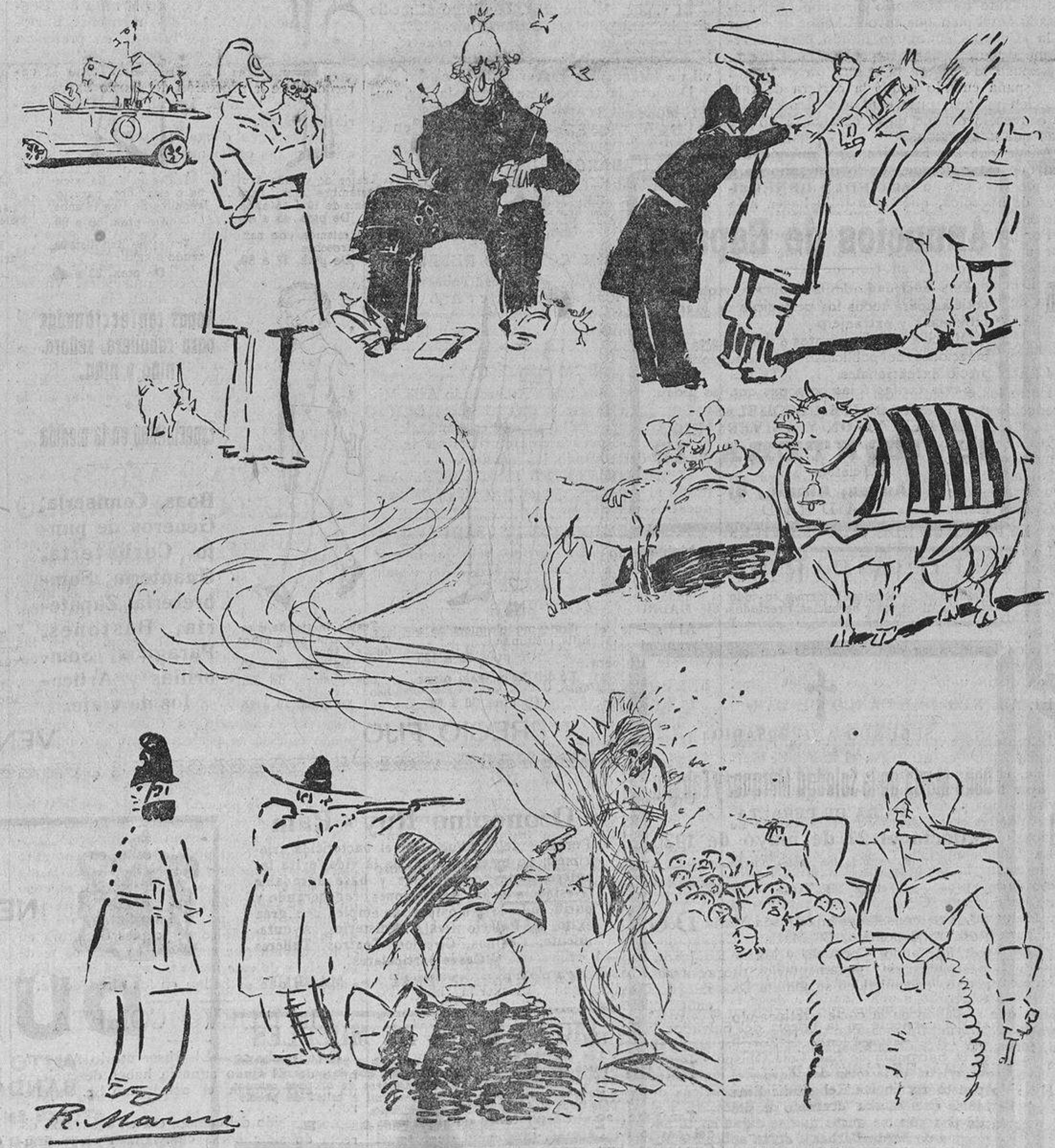
En los países protectores de los animales, y detractores, por tanto, de la fiesta de los toros, ha sido quemado a fuego lento y a tirlito limpio un desgraciado negro.