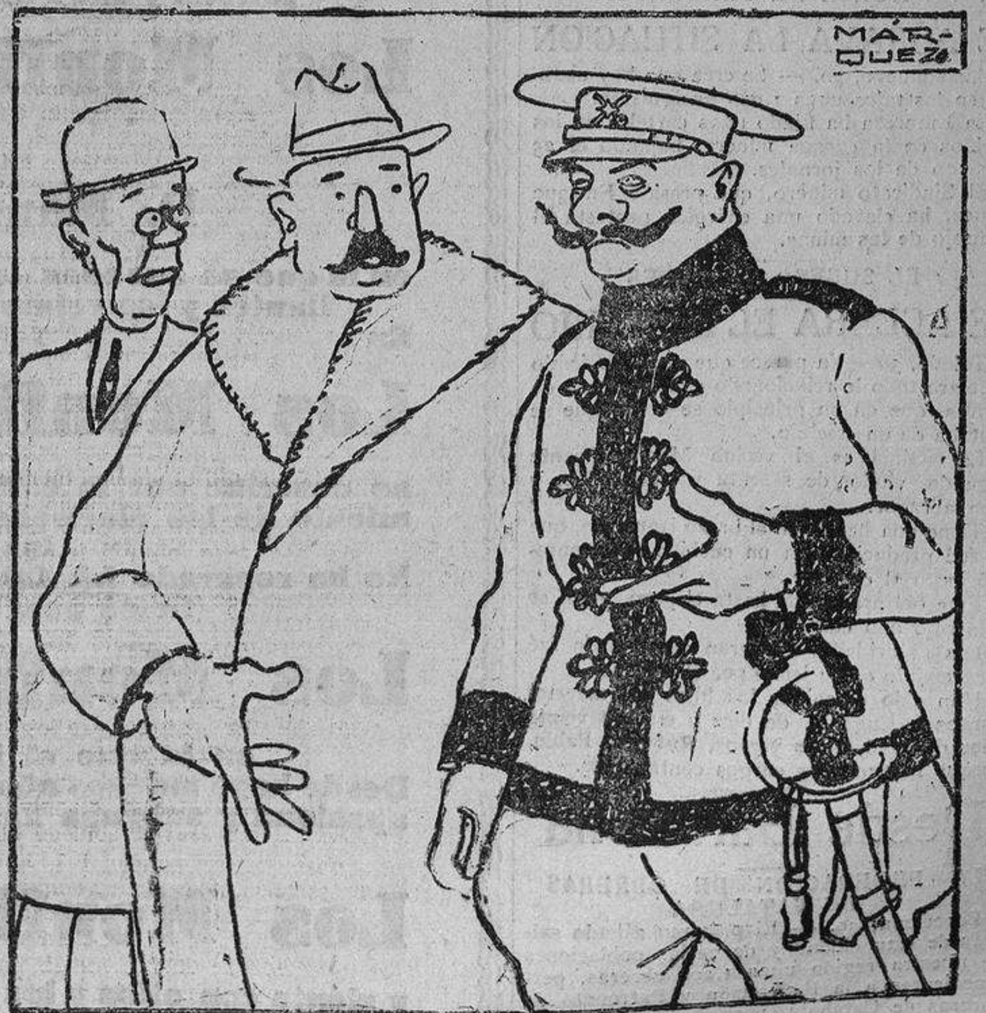
—Pero ¿y lo acordado en Pizarra? —Se ha borrado.