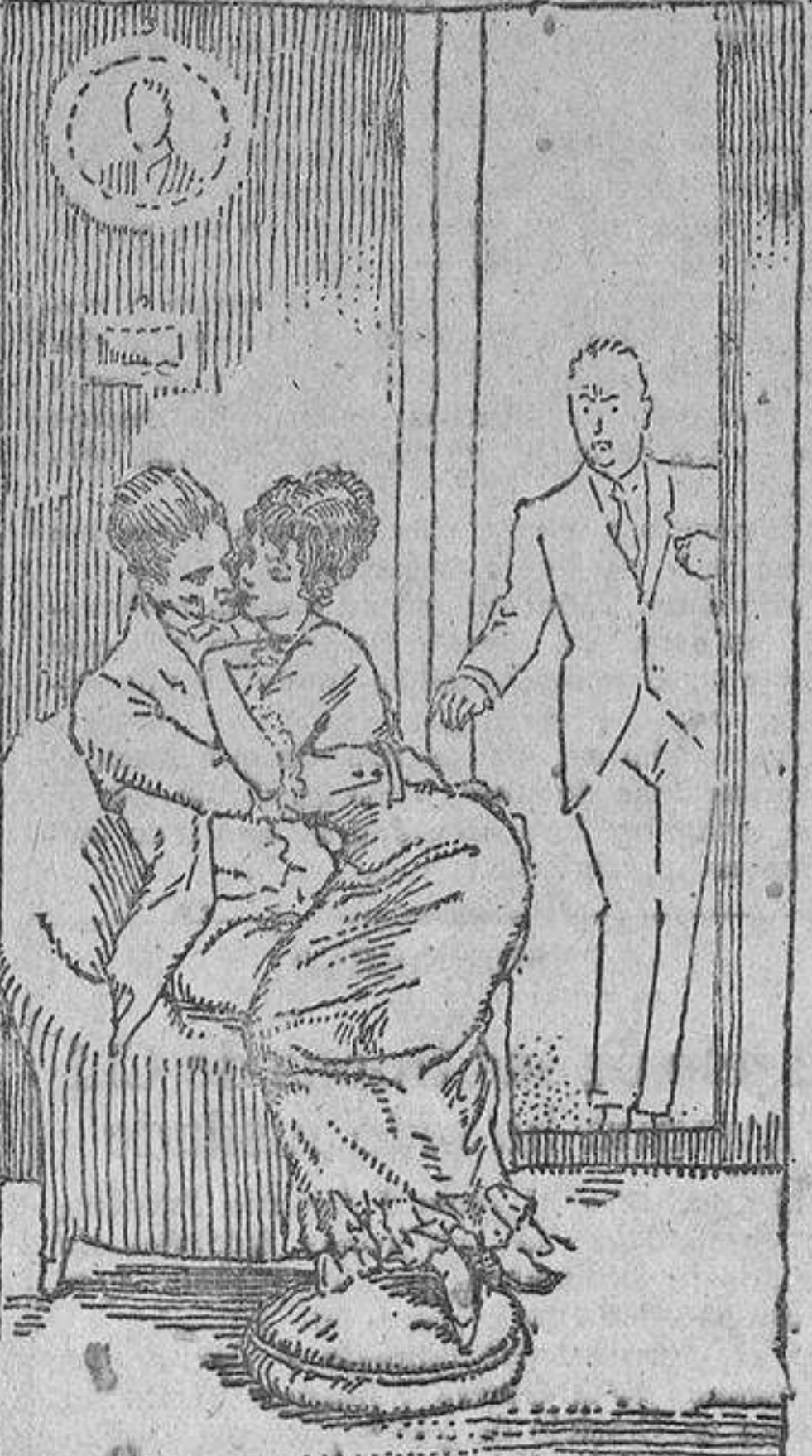
Nora se hallaba con mi criado...

Greenwood calló y esperó alguna palabra de su hijo; pero Jack no dijo nada. Entonces el padre, con un hilo de voz que era un suspiro, le preguntó: —¿Cómo me juzgas? Y el muchacho le repuso lacónicamente: —No te juzgo; te compadezco.