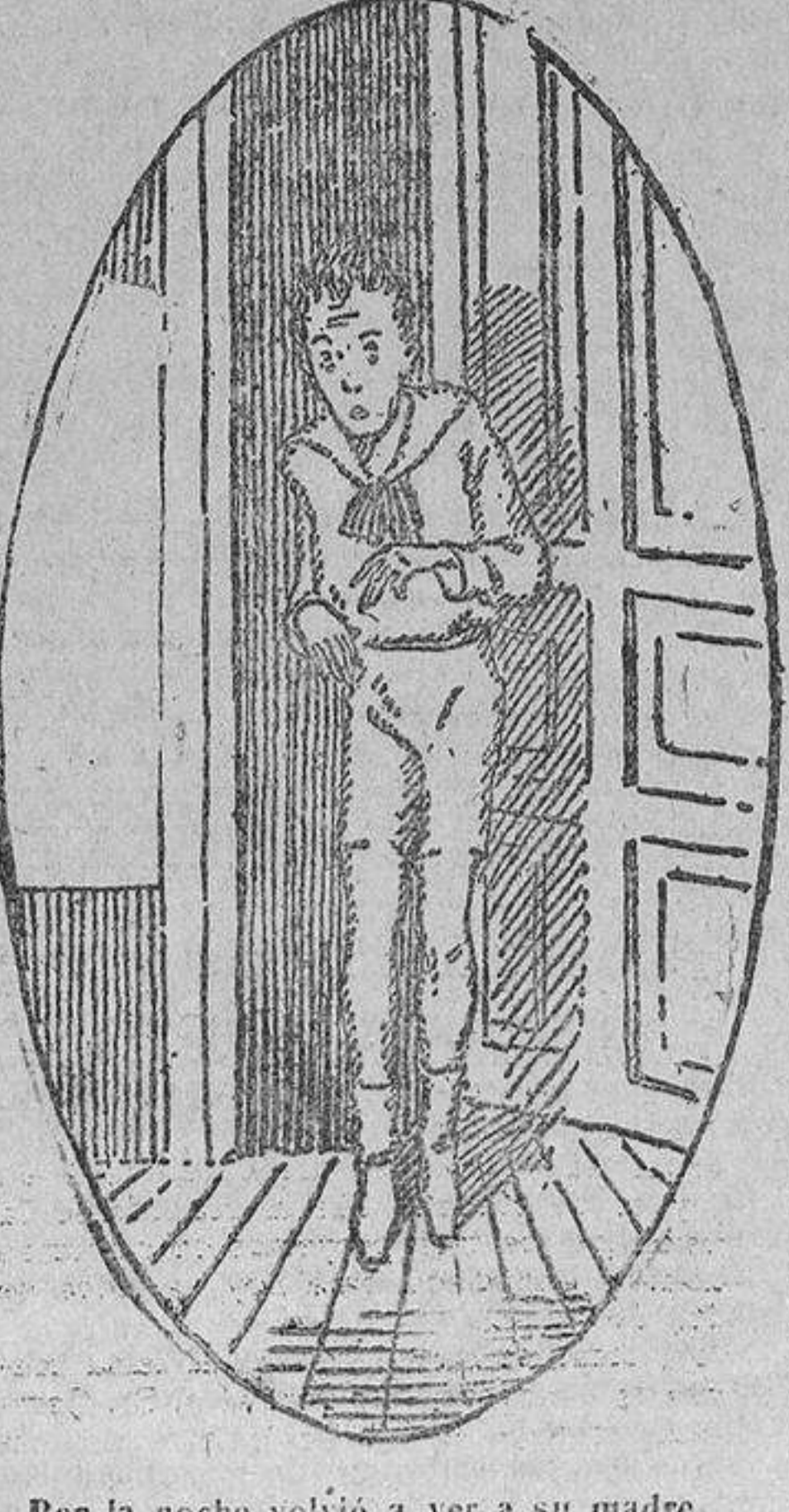
Por la noche volvió a ver a su madre...

El joven calló, y su padre, enorgullecido por el deseo de saber qué manifestaba el hijo, también; el ahijado tocaba a su