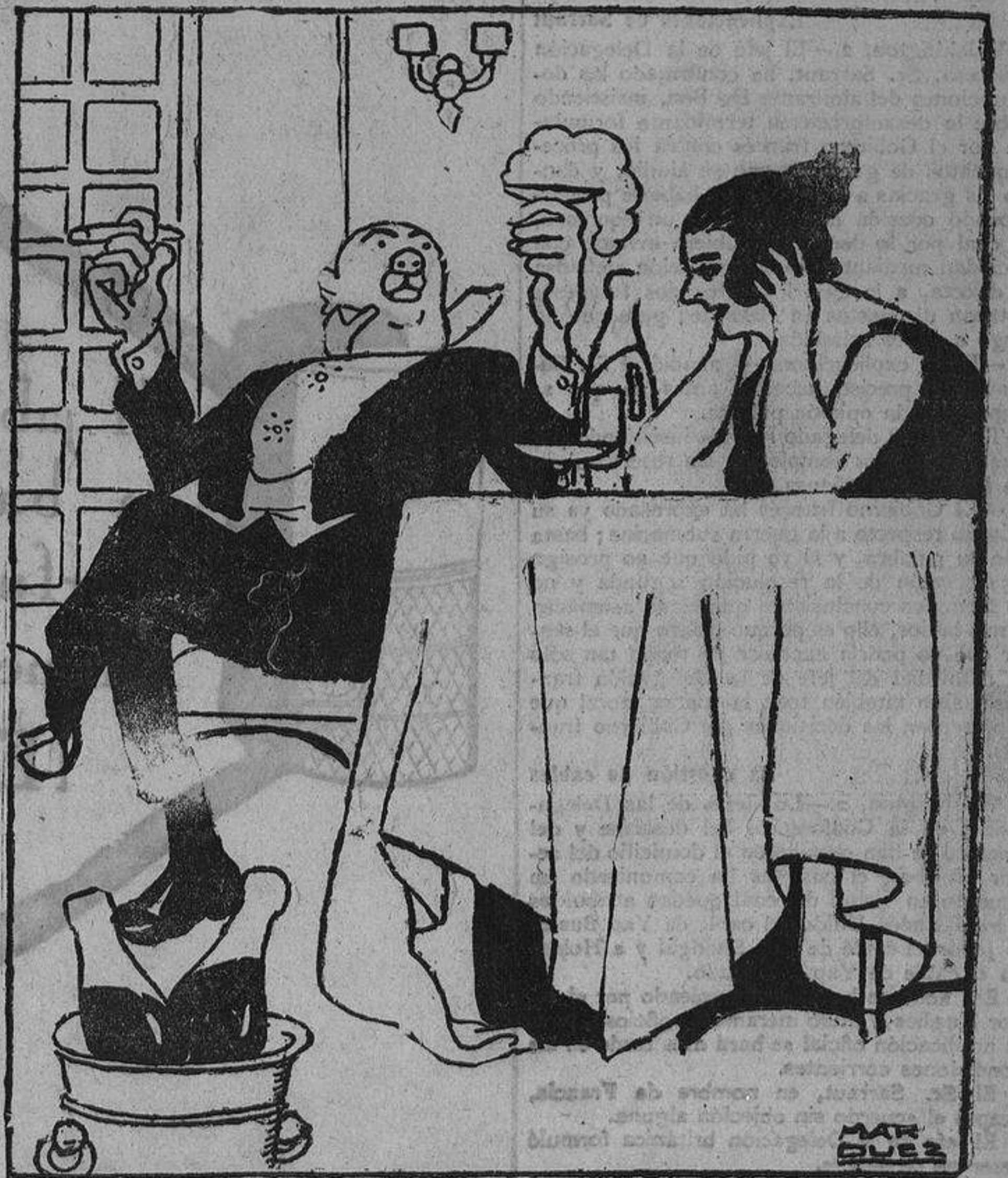
—¿Pero no decías que ibas a enmendarte, a cambiar de vida...? —Sí... Pero esto no es mas que saludar al año.