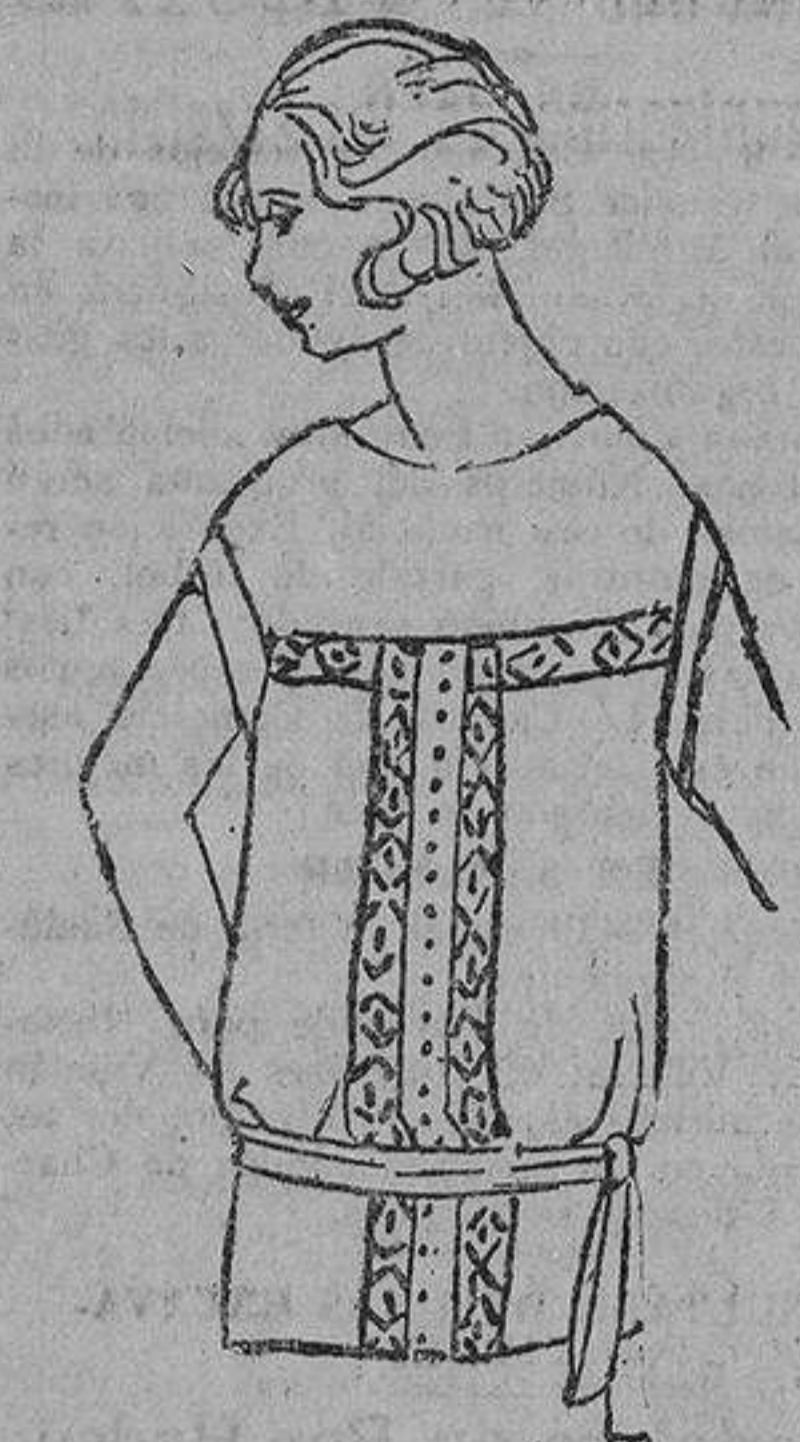
Sencillo blusón, adornado con bordados en seda de color en el delantero. El centro de estos bordados se completa con mostacilla.

En el deber de orientar a nuestras lectoras