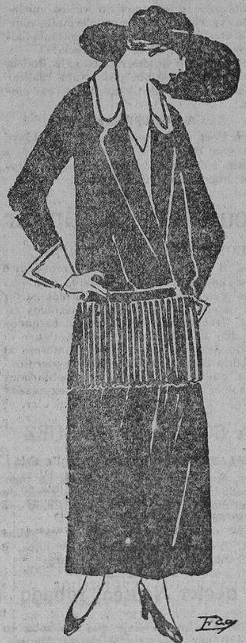
Traje sastre con pañilla negra con plisados en la cintura. El cuello y bocamangas adornados con blanco.

Hasta se dió un caso verdaderamente curioso: un hombre, entre sus papeles dejó una carta cerrada, con esta advertencia en el sobre: «Para ser abierta solamente después de mi muerte». En ella se declaraba que se consideraba marido de cierta mujer con quien había vivido muchos años. La corte rechazó la petición de la mujer, que pretendió que se la reconociese como viuda del difunto. Pero basta que un hombre prometa a una mujer que se casará con ella y que comiencen las relaciones, para que el matrimonio se considere existente desde el principio de las relaciones. Aun el divorcio se facilita en Escocia, pues basta que el marido o la mujer se hayan ausentado del hogar durante cuatro días, para que la ley otorgue la separación.