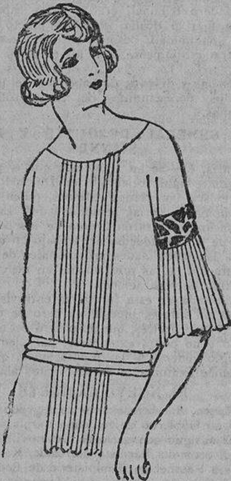
Sencillo blusón, adornado con plisados en el delantero y mangas, las cuales van con bordados de fantasía.

Luisina.— Me explico su desorientación en estos momentos; pero, ya que me lo pregunta, le daré mi consejo. Creo que el agua de Colonia que debe usted escoger para su tocador es el Agua de Colonia Abeja, que es transparente, rica en alcohol puro y suavemente odorífica. El Agua de Colonia Abeja,