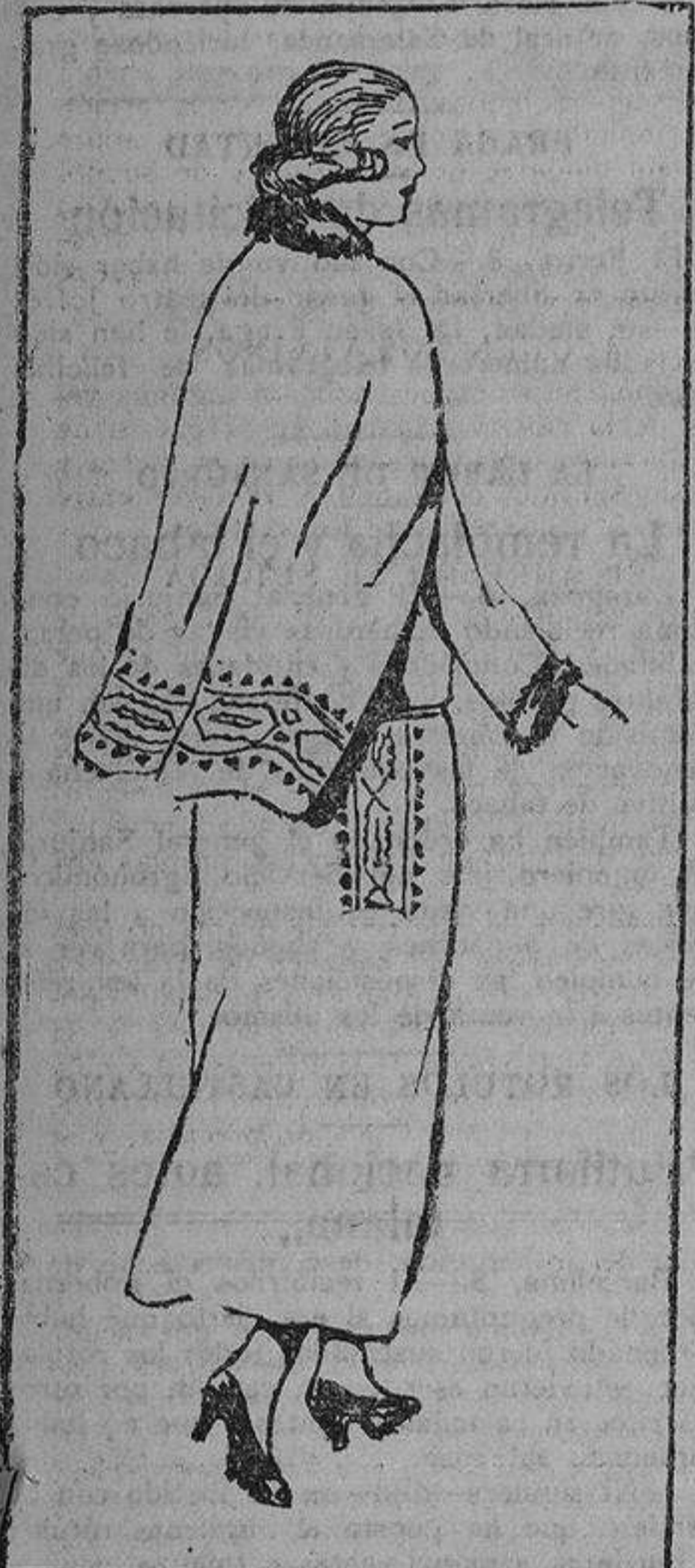
Abrigo capa de lana y bordado en las caderas y borde de la capa con sedas. El cuello y mangas se adornan con piel.

En la actualidad, el zapato de piel de anti-