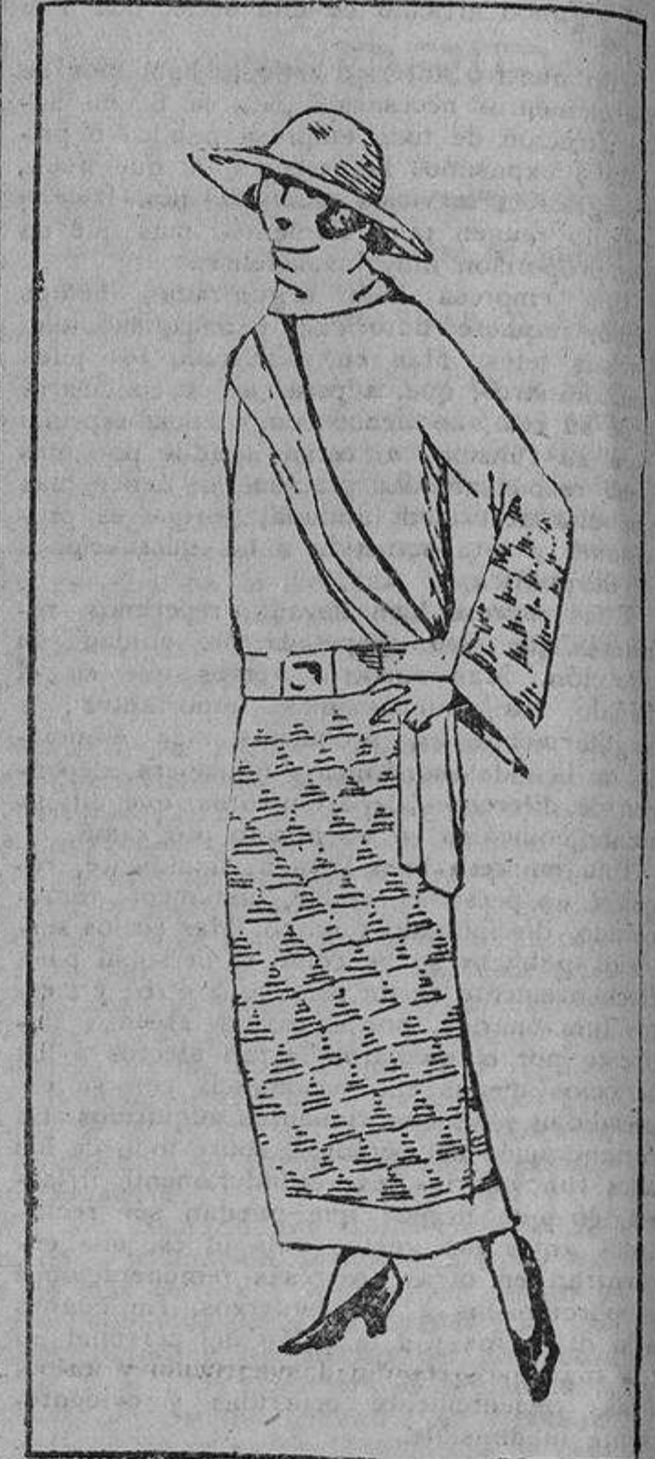
Abrigo cruzado de lana y bordado en mangas y falda con seda de tono más oscuro al del color del abrigo.

por la Perfumería Gal. Estos dentíficos, que se fabrican en Elixir, Pasta y Polvos, pueden usarse indistintamente, pues todos ellos tienen las mismas propiedades. Para conseguir un buen resultado es muy conveniente el uso constante de cualquiera de los Dentíficos Dens, dedicando aunque no sean más que dos minutos diarios al cuidado de la dentadura. Cuando haya conseguido emblandecer su dentadura, no deje usted de continuar empleando la Pasta, el Elixir o los Polvos Dens, pues le conservarán la blancura y fortaleza de sus dientes. Si viese usted