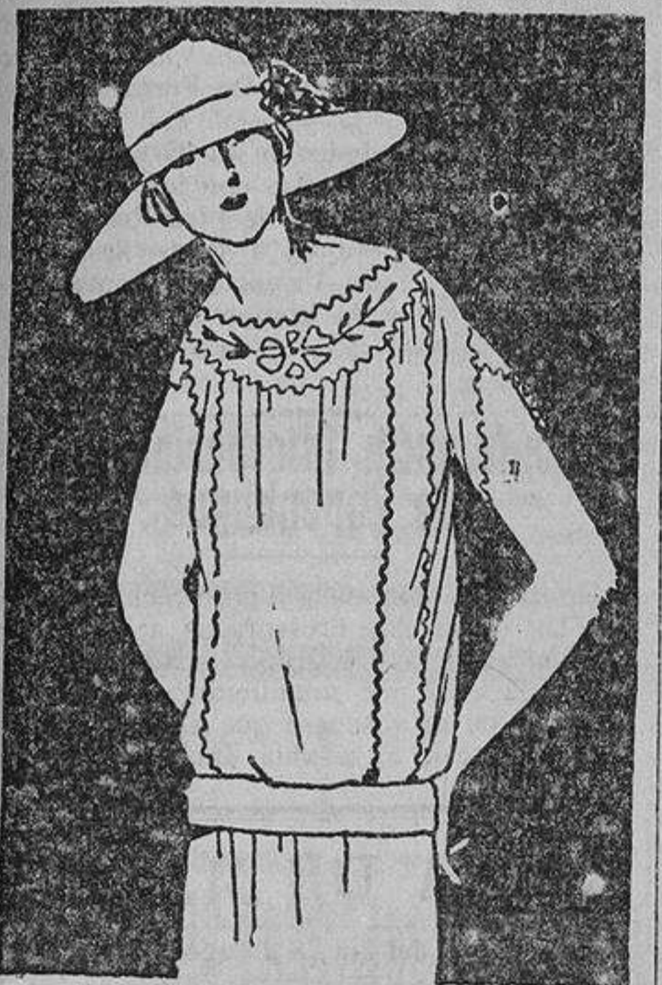
Sencillo blusón de crespón con bordados en seda.

«Artículo 3.º Con carácter provisional y hasta la implantación de la caja del Seguro obligatorio de maternidad a que se refiere el artículo que antecede, cuyo estudio se en-