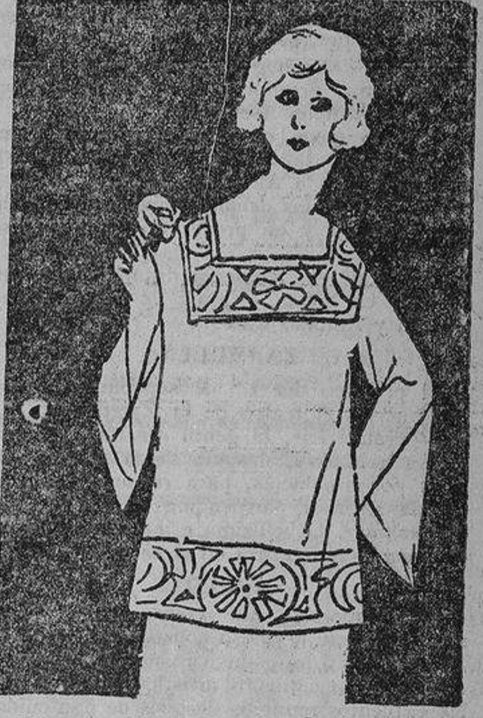
Elegante blusa de seda con bordados en colores.

Una cuarentona.—Para limpiar la dentadu-