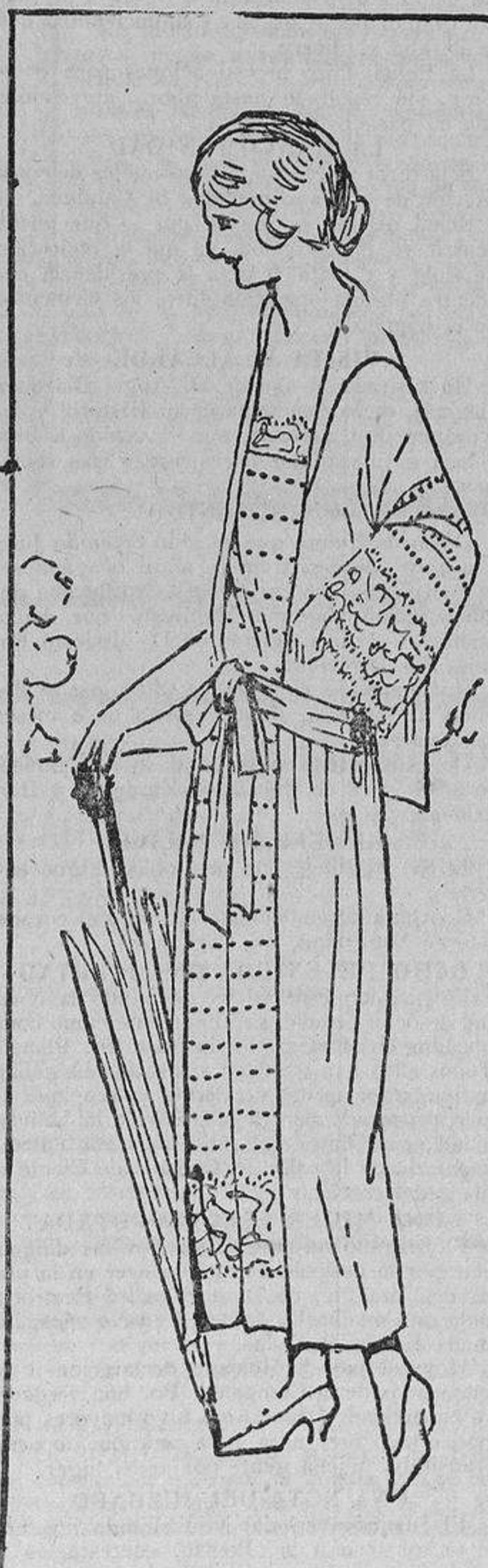
Vestido de crespón con las mangas y delanteros bordados en colores. Lleva una banda sujetando la cintura.

Acaso el procedimiento pueda parecer un poco caro, ya que para destilar el jugo necesario en una semana de baños se necesitarían alrededor de un par de toneladas de fresa y casi la misma cantidad de frambuesas.