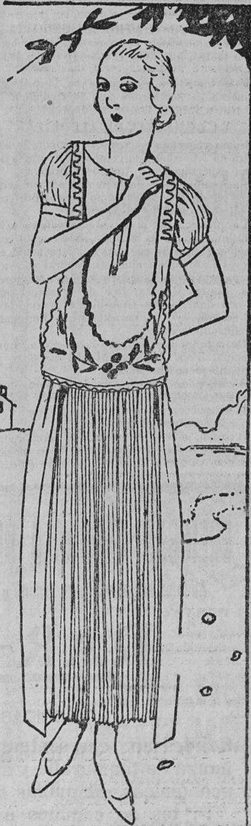
Vestido de crespón «marroquin» blanco, adornado con crepé azul vivo y bordados en color. La falda plisada.

No se deben usar pendientes en las orejas. En cuanto termine de hablar, abandone la tribuna y siéntese.