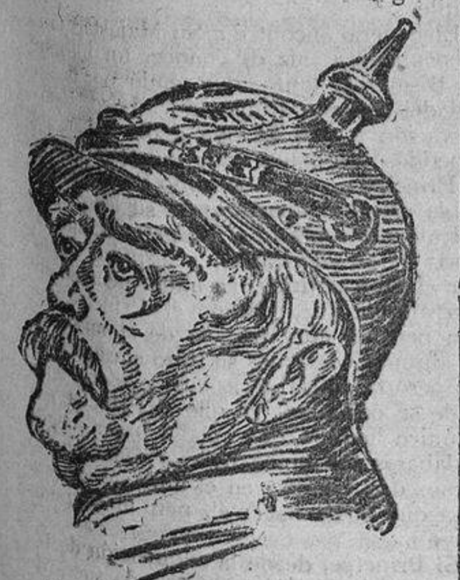
El canciller Príncipe de Bismarck

El Príncipe me dijo un día que su intención principal era no dejar a Rusia e Inglaterra llegar a un acuerdo. Entonces me atreví a decirle: «Ese momento, si volvemos la vista atrás, estuvo a punto de existir si en 1877 a 1878 los rusos se hubieran quedado con Constantinopla. Entonces la flota inglesa hubiese ido segura-