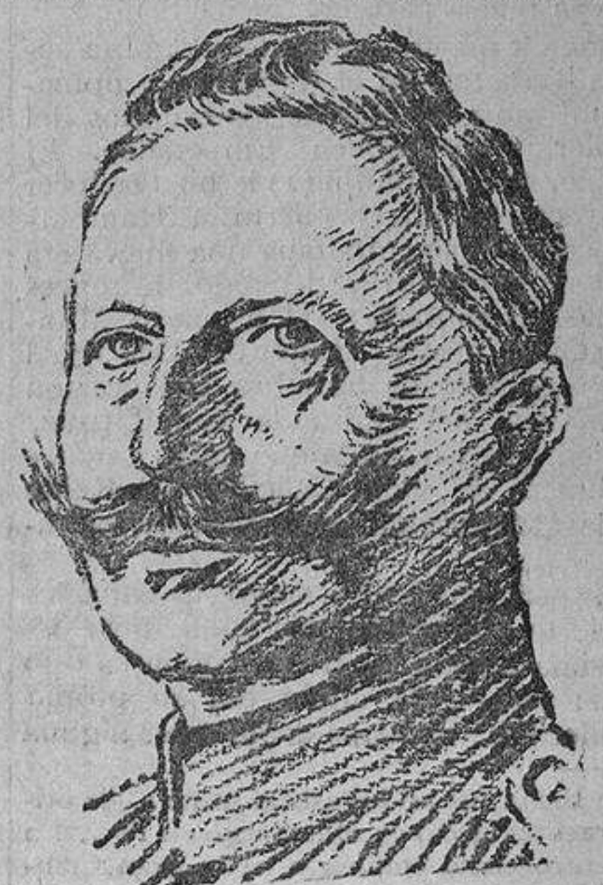
El Kaiser, Guillermo II, al comenzar la guerra

Yo entonces sentí en el alma el conflicto que entre nosotros nació; pero tuve que tomar el camino de la igualdad, que ha sido siempre, y sobre todo en la política interior, mi camino. Por eso no me decidí a adoptar una lucha declarada contra la «Social-Democracia», según deseaba el Príncipe. Estas diferencias sobre los ideales políticos no amenguaban mi admiración por la grandeza de aquel hombre de Estado, de Bismarck. Siempre quedé su recuerdo en mí como el del creador del