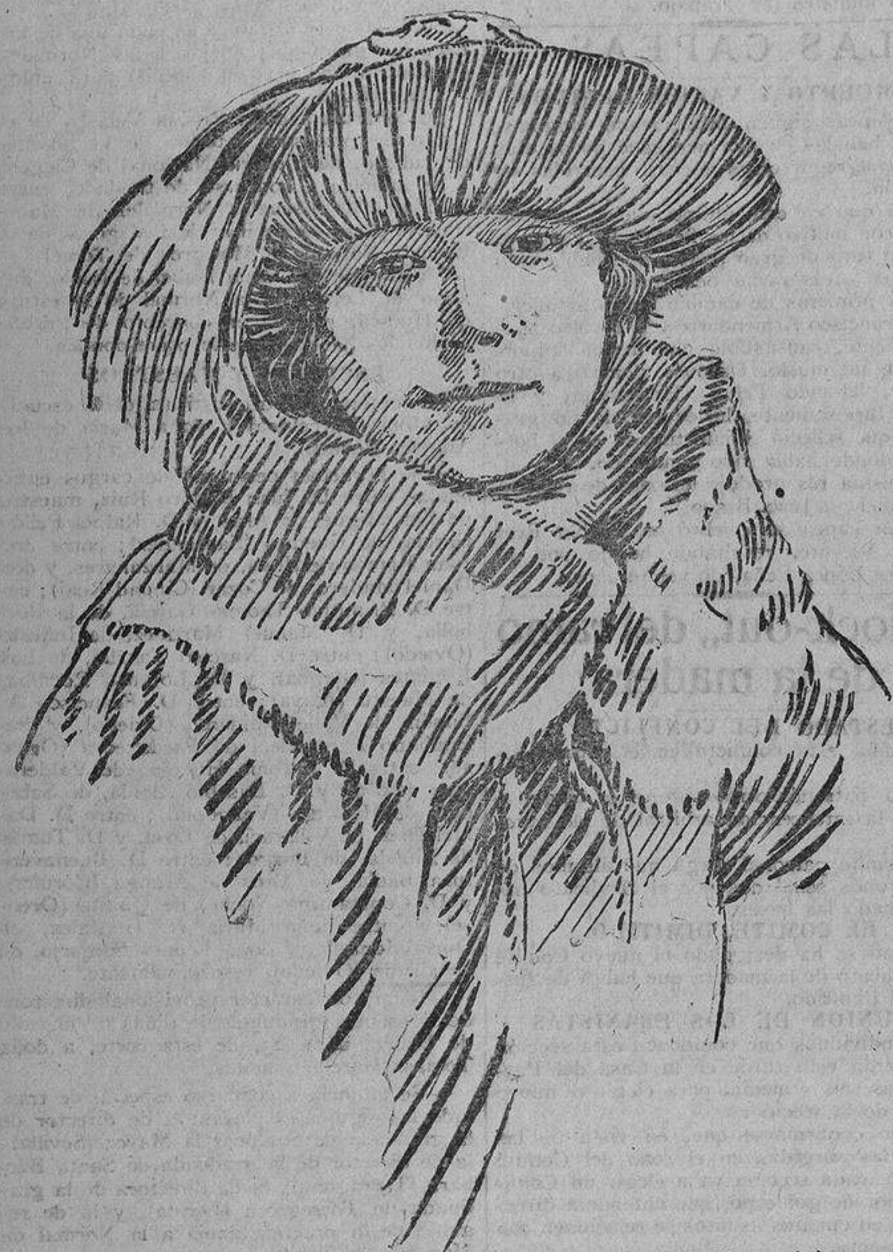
Margarita Xirgu, intérprete de la Dorotea en «La niña de Gómez-Arias».

Drama de Calderón de la Barca, refundido por D. Eduardo Marquina