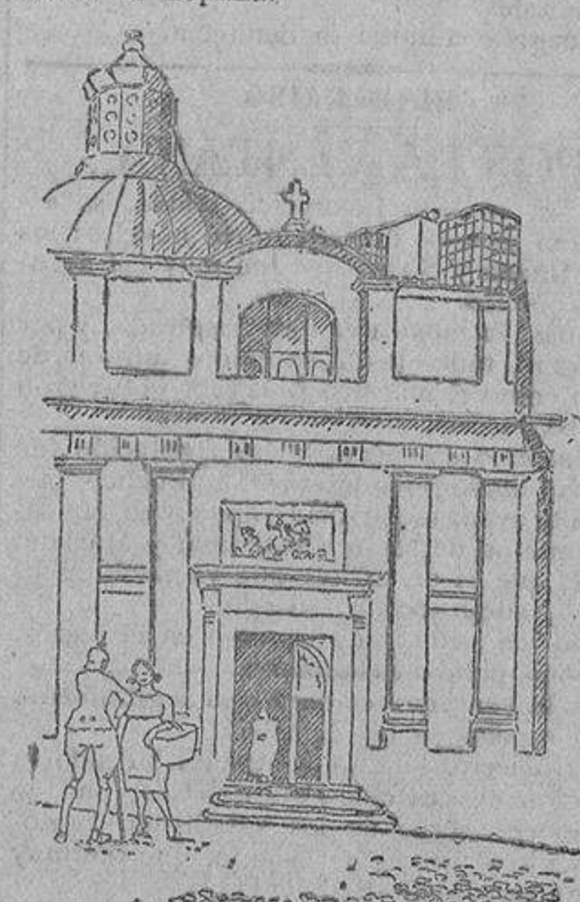
Fachada de la iglesia de Santiago

Las fiestas religiosas han congregado muchos fieles en la iglesia parroquial, en la que se han celebrado cultos en honor del santo Patrón de España.