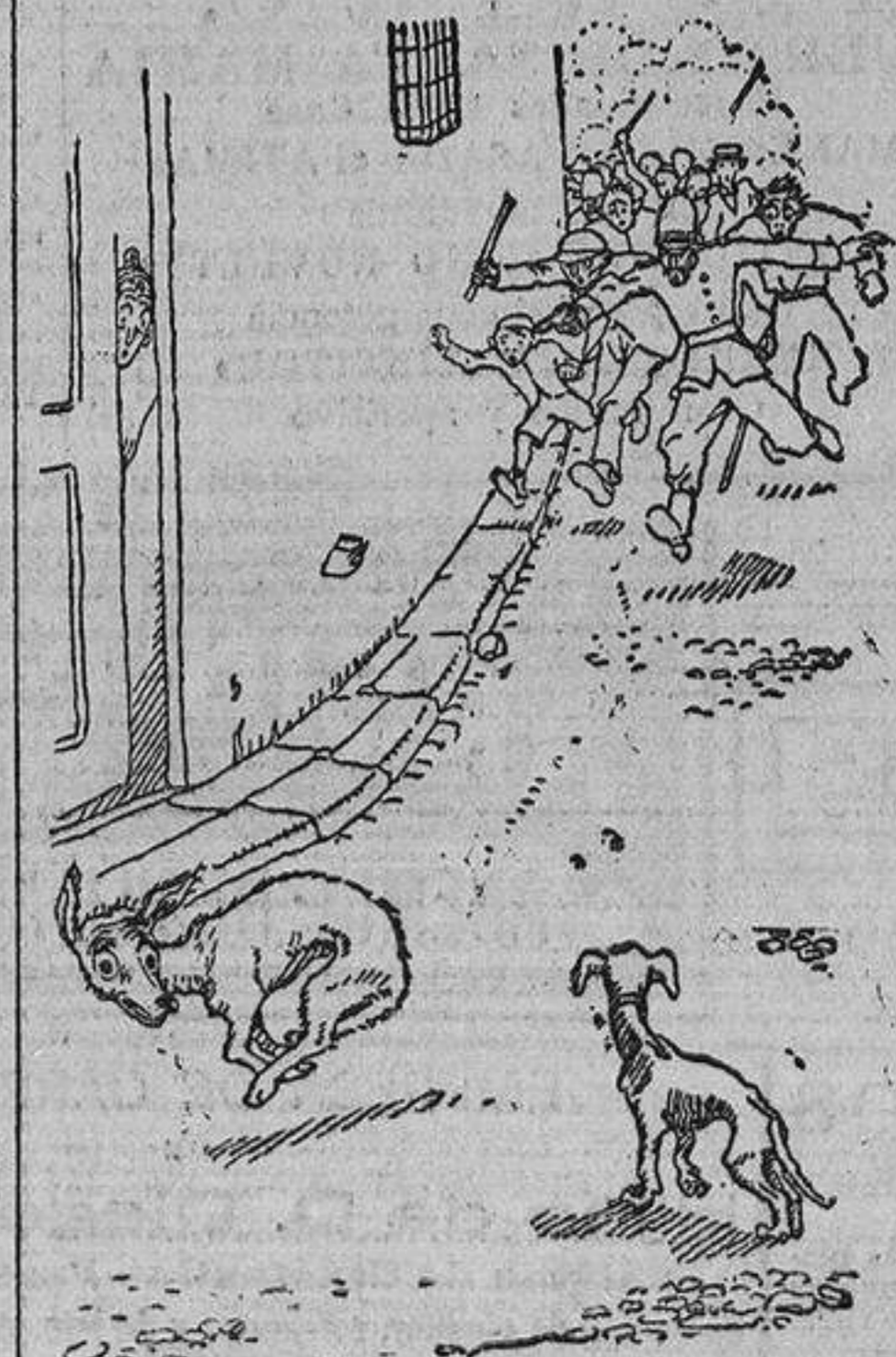
El can perseguido.—¡Huye, Tom, huye! El otro perro.—¿Qué pasa? El perseguido.—¿No ves? ¡Que esa gente está rabiosa!

con creces las aspiraciones del personal y dotar cumplidamente todos los servicios. La distribución a domicilio es tan defectuosa, que permite vivir holgadamente a mensajeros particulares que, a la sombra de los defectos apuntados, hacen a Correos una temible competencia.