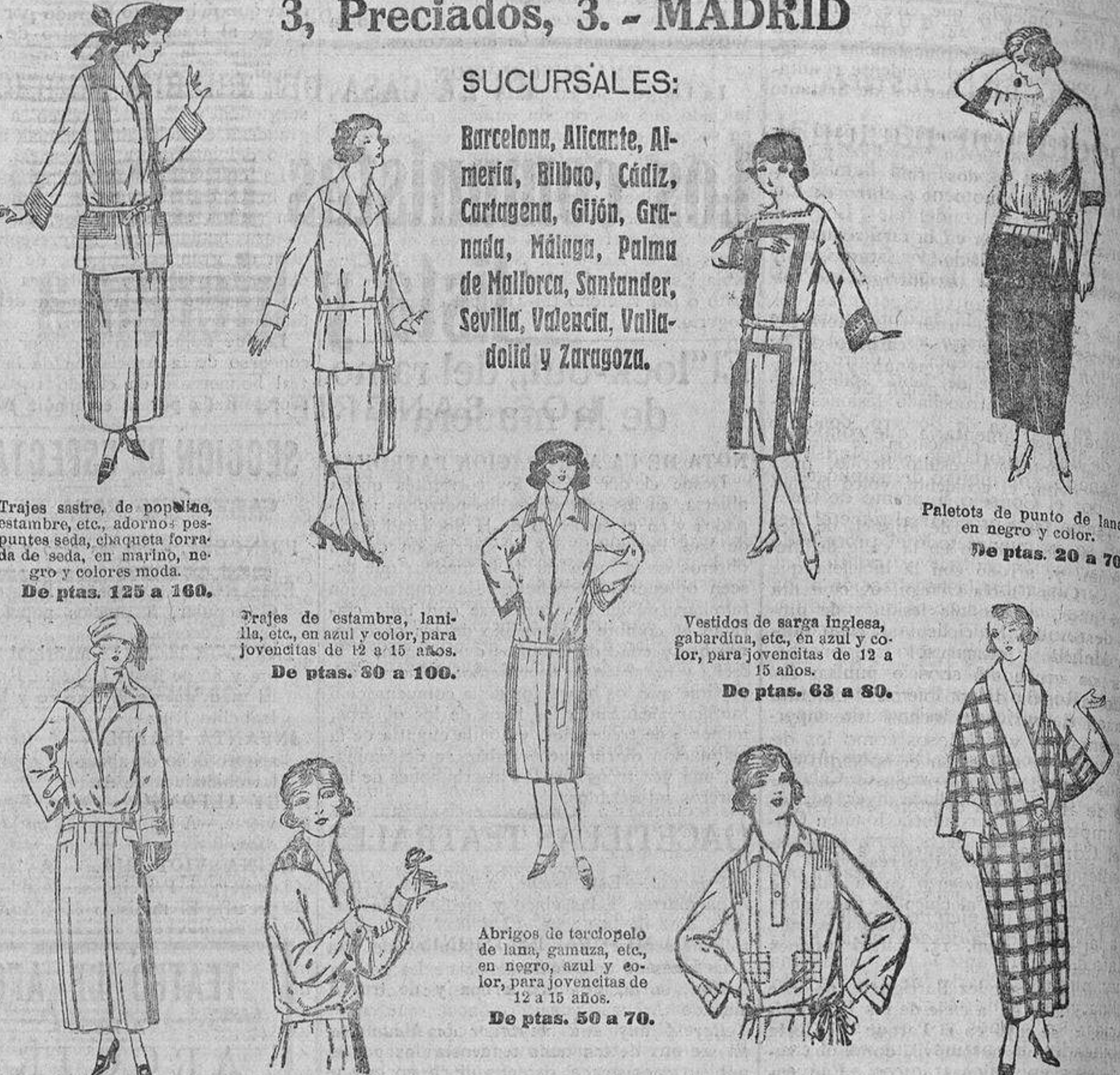
Trajes sastre, de popeline, estambre, etc., adornos pespunte seda, chaqueta forrada de seda, en marino, negro y colores moda. De ptas. 125 a 160.

Barcelona, Alicante, Almería, Bilbao, Cádiz, Cartagena, Gijón, Granada, Málaga, Palma de Mallorca, Santander, Sevilla, Valencia, Valladolid y Zaragoza.