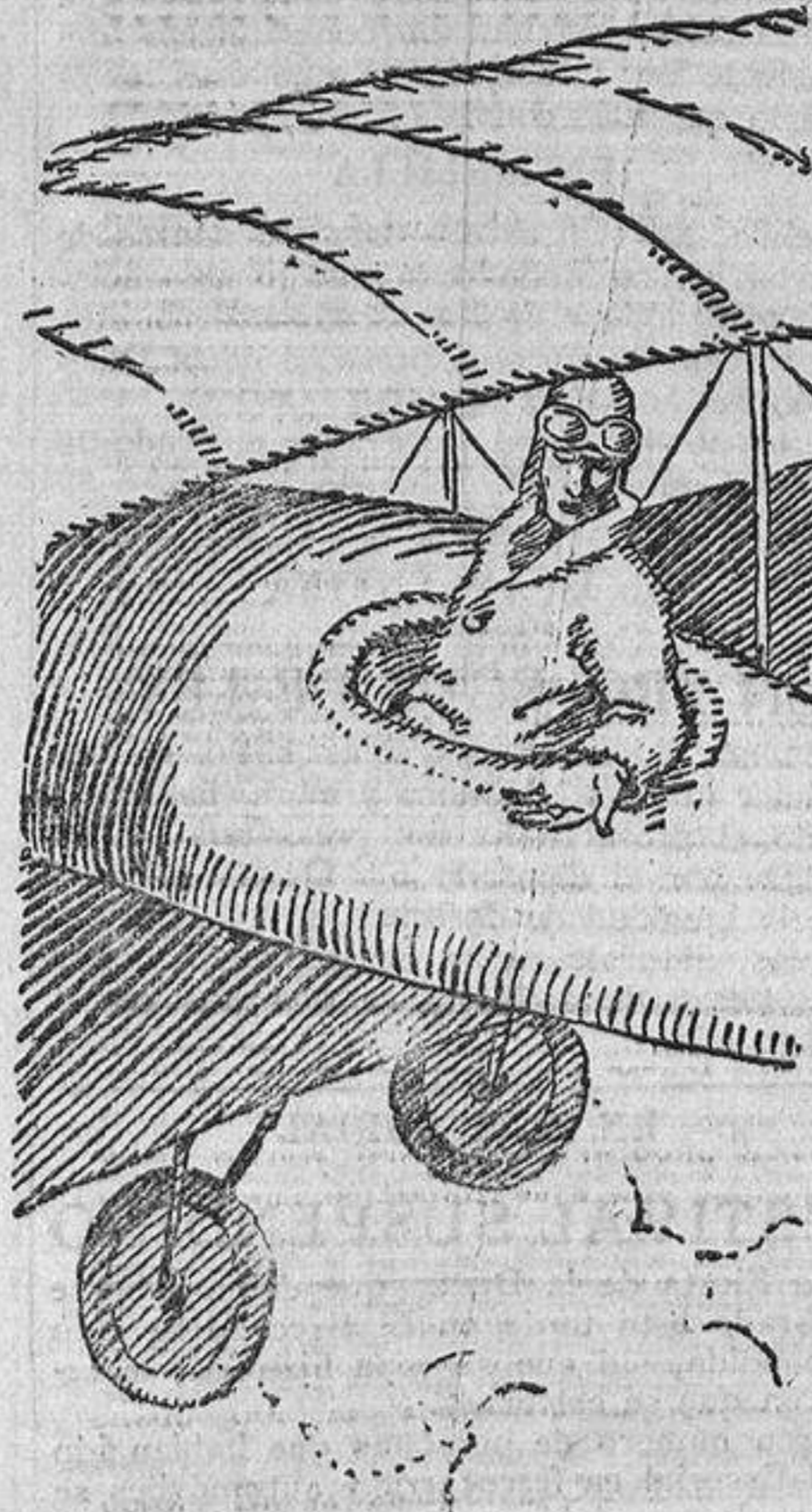
—No se reciben encargos para las estaciones de la línea.

den ingresar en una Corporación para la que no hicieron oposiciones, y desean correr la suerte nuestra.