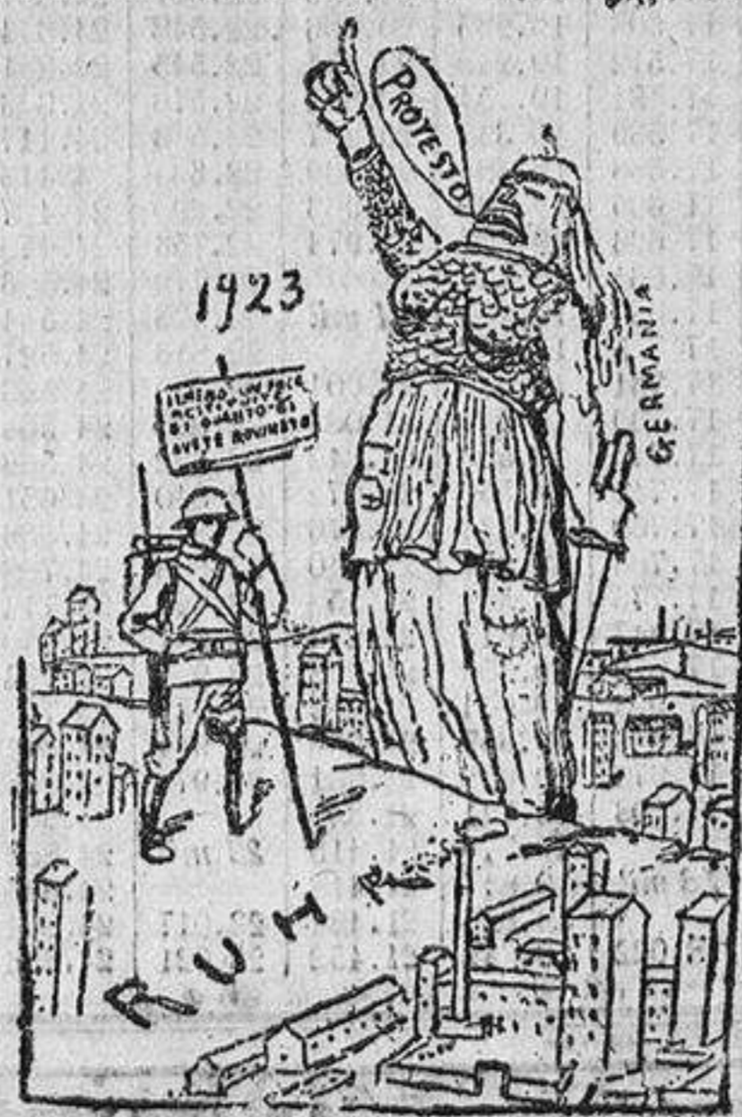
Alemania protesta contra la invasión francesa; pero...