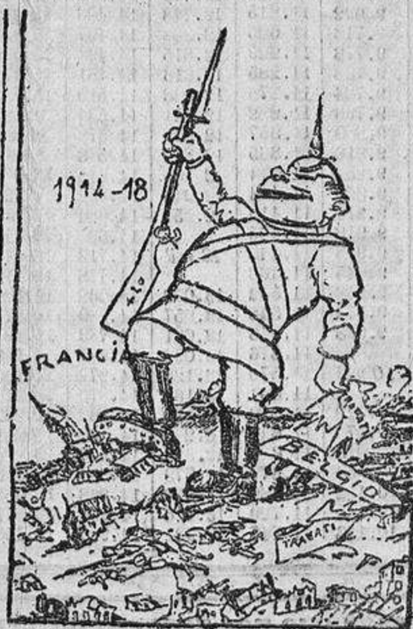
Con un poco de memoria... (Le Zoo, Florencia.)