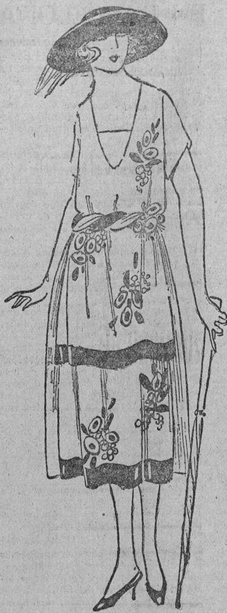
Blanco, bordado en rusa y con dos volantes sencillos delante, con tiras rusa.