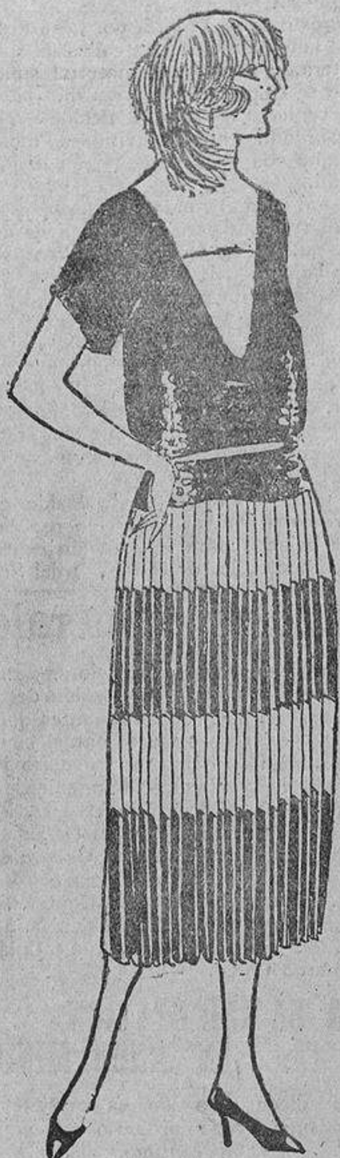
El cuerpo de crespón de lana verde mar, y a la falda plisada, de crespón, blanco y verde

¿Por qué han ido a inspirarse en las modas españolas, cuando en Francia tenían ancho campo donde inspirarse en modas exclusivamente francesas? Esto se de-