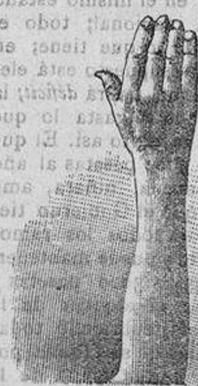
Después de 15 días de la curación