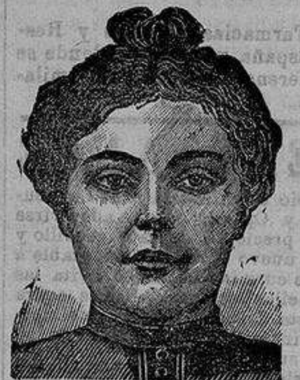
Después de 15 días de la curación