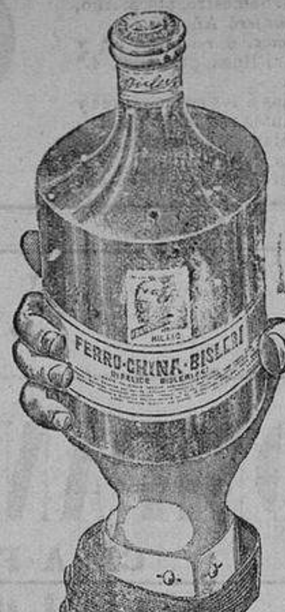
Ferro-Quina-Bisleri. - Aperitivo Higiénico. Reconstituyente de primer orden, recomendado por la clase MEDICA. Depósito: Bajada de San Miguel, 1.º y 2.º.