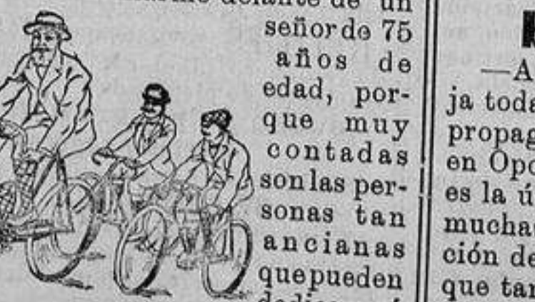
los placeres de la bicicleta.

—Las alocuciones del señor alcalde dando la bienvenida á Prelados y forasteros, y al pueblo burgaleses, son muy sentidas y propias del caso, sien-