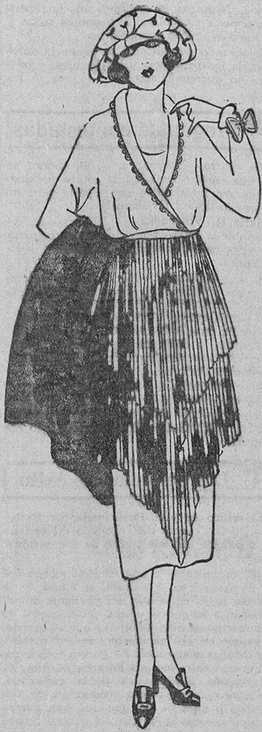
La «difícil facilidad» de un vestido sencillo y a la vez elegante, reside en este modelo de crespón de china gris perla, en los volantes plisados formando picos detrás y delante y en el cuerpo de una sobriedad de buen gusto.