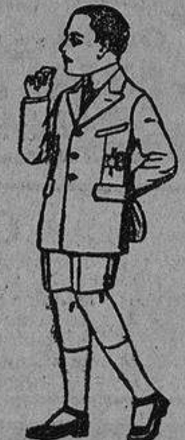
Trajes modelo Sport, de lanilla, estambre, melton, etc., para niños de cuatro a nueve años. De ptas. 30 a 48. Trajes de dril liso o listado. De ptas. 9 a 18.