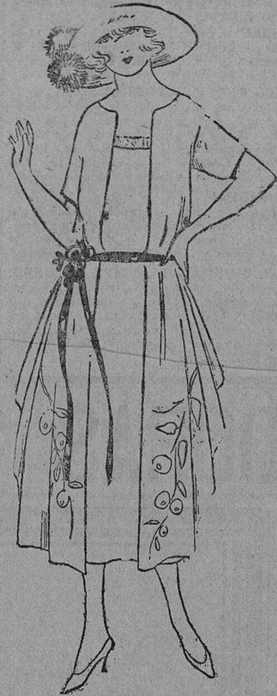
Elegante y juvenil traje en linón color crema con bordados de frutas en colores apropiados.