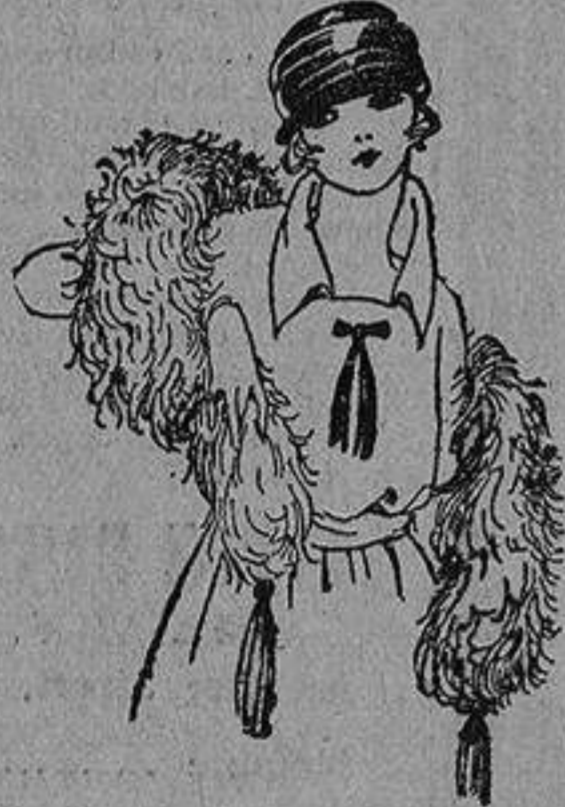
Chales de plumas de avestruz, gran variedad en colores y tamaños. De ptas. 15 a 125. Gran surtido en capulinas de marabú. De ptas. 30 a 70.