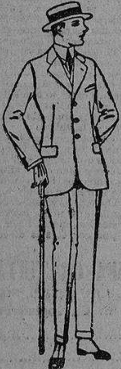
Trajes de lanilla melton, estambre, vicuña o jerga. De ptas. 38 a 130.

SUCURSALES: Barcelona, Alicante, Almería, Bilbao, Cádiz, Cartagena, Gijón, Granada, Málaga, Palma de Mallorca, Santander, Sevilla, Valencia, Valladolid y Zaragoza.