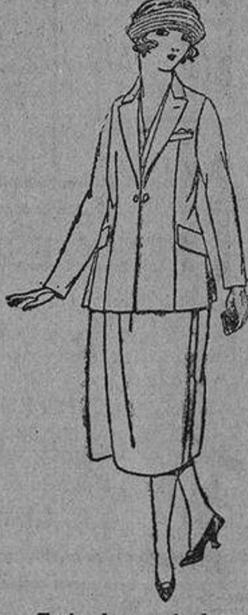
Trajes de punto de seda, en negro, azul y color. De ptas. 150 a 188.

Ropas confeccionadas para Caballero, Señora y Niños