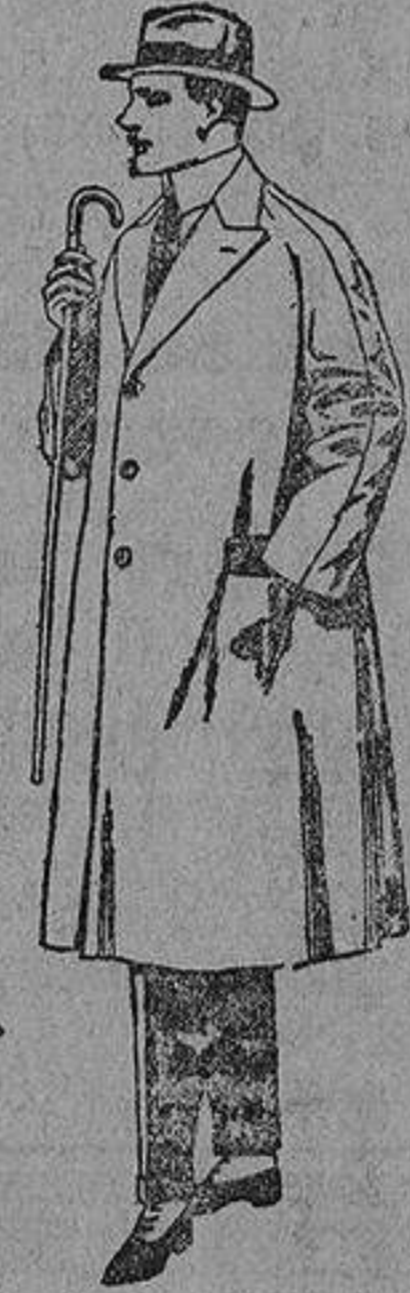
Gabanes de melton, gabardina, etc. De ptas. 70 a 150.