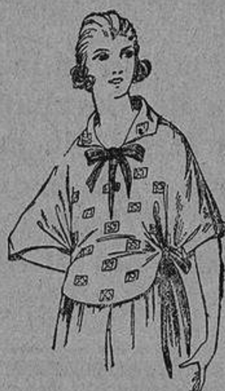
Blusas de crepón de seda, volle y etamin estampado. De ptas. 4 a 25.