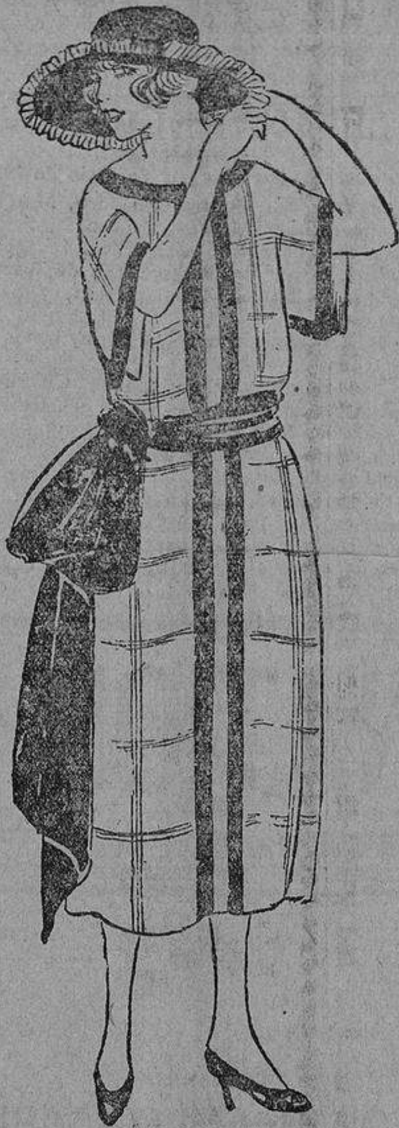
Señillito y propio para muchachitas este traje de seda azul marino a rayas verdes con vivos y banda, verdes también.