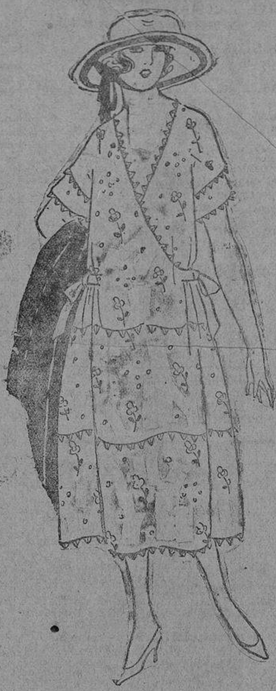
Igualmente encanta este juvenil traje de organdi blanco, sembrado de florecillas y adornado con picon de la misma tela.