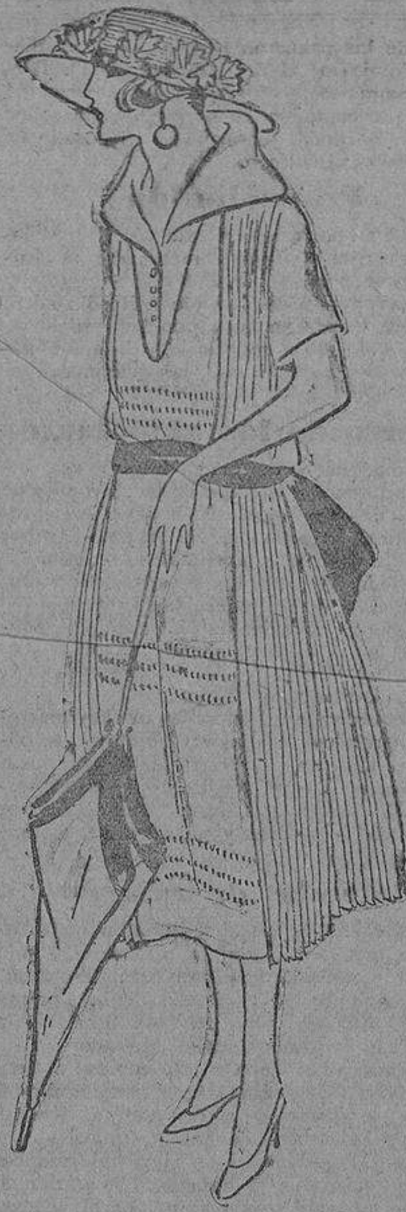
Pero los dos anteriores no consiguen eclipsar la discreta sencillez de este otro, de crespon de seda rosa pálido con bordados y pechero blancos.

cho de este asunto. Enhorabuena y que le guste con felicidad.