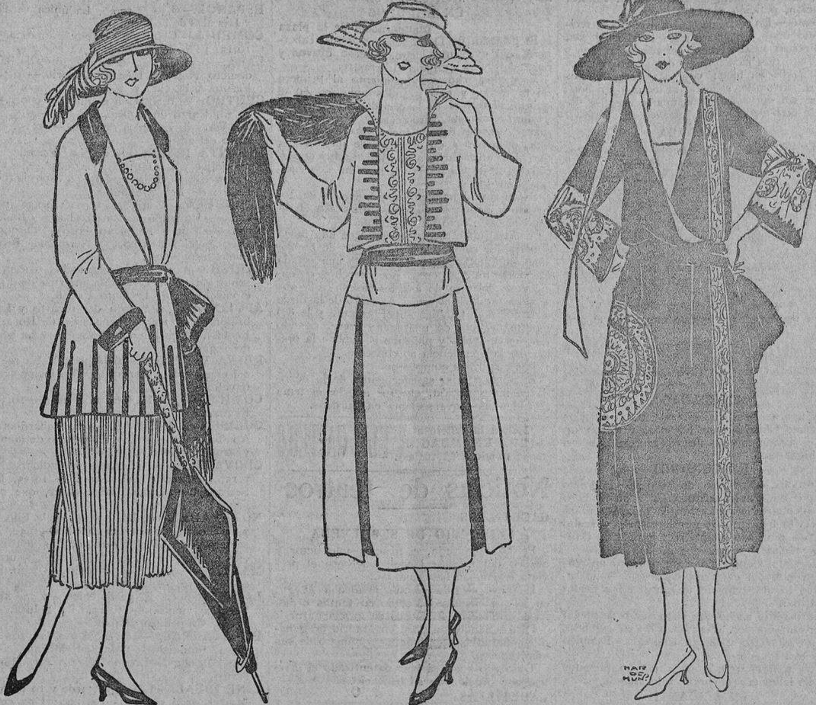
Sencillo traje sastré fantasía en gabardina rofia oscura adornado de cintas encerradas; falda plisada.

Por coquetería y falsa modestia no dicen ellas todo esto; lo dice un «manager», que siempre las acompaña haciendo las veces de secretario, intérprete... e incensario; éste es el que se entiende con empresarios y periodistas y es el encargado