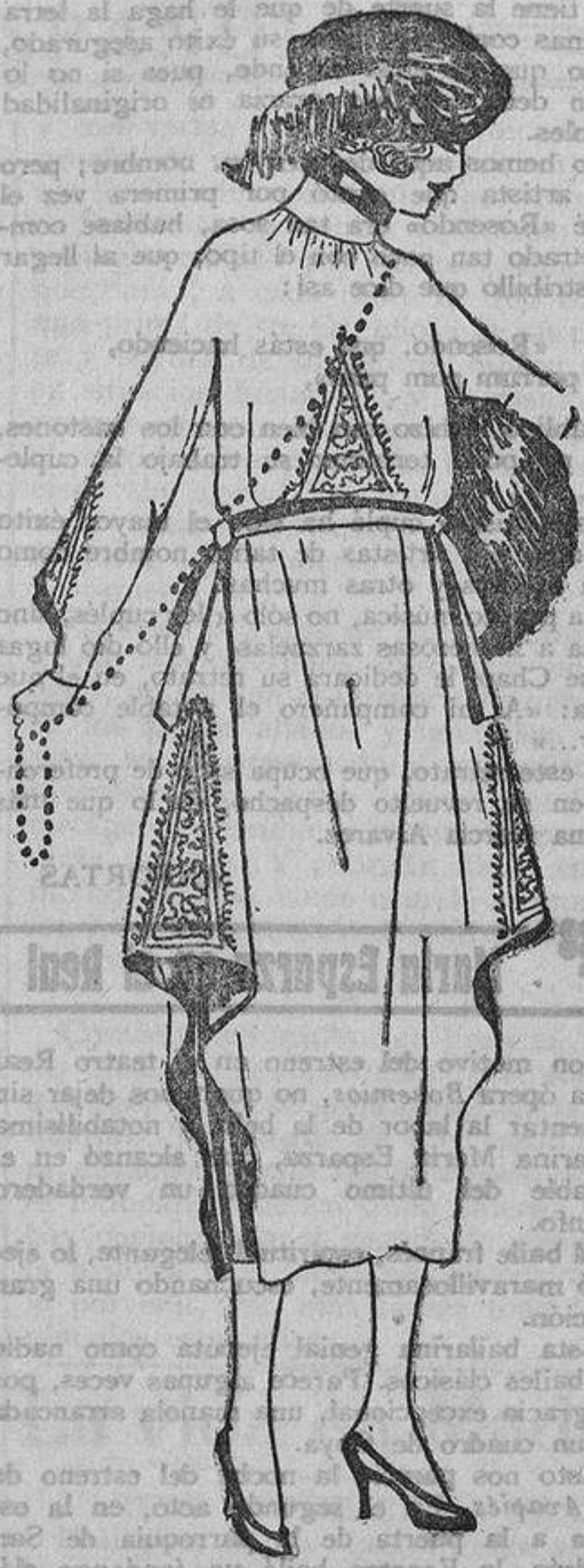
De fina jerza azul marino, sobre una faldita estrecha de raso negro; la falda está forrada con raso negro que se ve a los lados; bordados de «soutaches» negro, cuello y cinturón forrado de raso negro.

Una joven de antaño era un sér irreal, algo niña, apenas mujer, ignorando completamente la vida, viviendo a ciegas. Una especie de planta graciosa, crecida en una estufa, rodeada de cuidados, garantizada de choques, de la mucha luz, del gran aire. Cuando esta fragilidad era arrojada a la vida, para cumplir su papel de mujer, de esposa, de madre, entre diez, cinco eran para sufrir y hallar el desengaño de todos sus sueños, de todas sus ilusiones, el naufragio de todas sus aspiraciones, y empezaba el desfile de las resignadas, en las