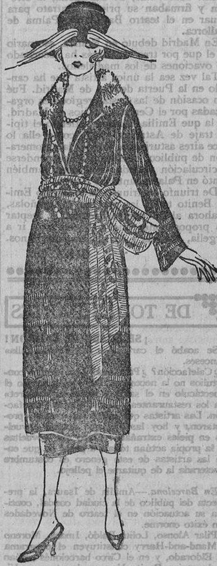
Cuando la banda que rodea el talle es voluminosa y adornada, el vestido debe ser sencillo; este modelo de jersey de seda negro tiene unas tiras y una banda hechas a punto de aguja con hilo de plata oxidada.

naturalezas sumisas, dulces; de las rebeldes en las naturalezas violentas. La grey femenina llegaba a una conclusión: la mujer era una víctima.