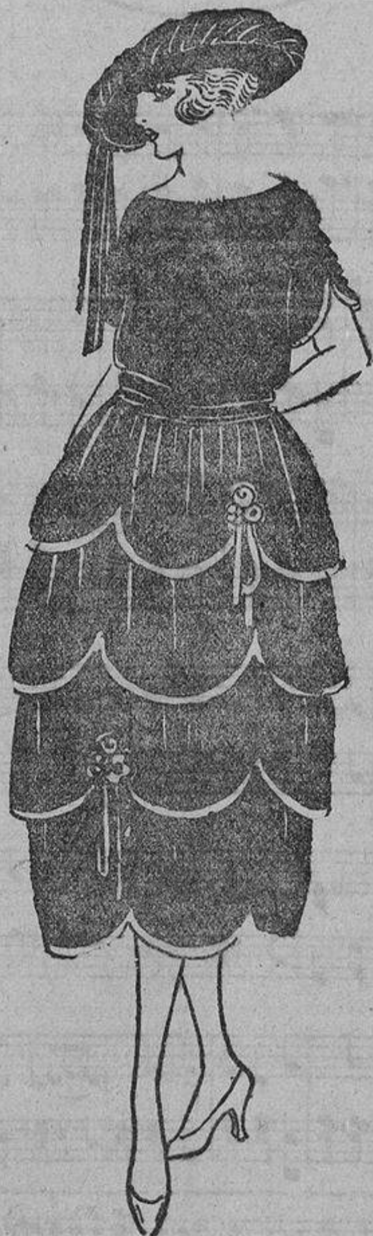
Para parecer una rosa de algún jardín imaginario nada tan propio como este vestido de tafetán azul marino, con sus cuatro volantes recortados en ondas ribeteadas con cinta «nattier»; grupitos de flores.