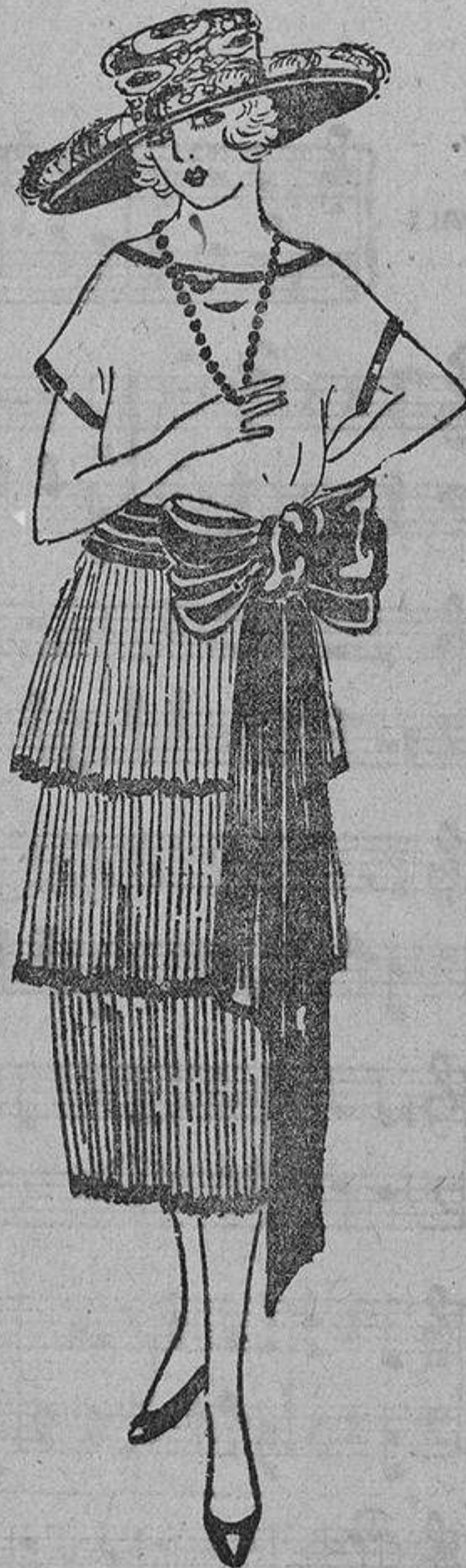
De crespón de seda coral; el cuerpo sencillísimo y de corte amplio; la falda con tres volantes plisados. Gran banda de tafetán azul marino, así como los vivos.

son sencillamente entalladas o rectas; de usar cinturón, suele ser muy estrechito y atado a un costado, o rematado con una hebilla cuando no da dos vueltas alrededor del talle. Algunos, como nota «chico» que no pasa nunca de moda, tienen un cinturón de cuero trenzado, de color gris, marrón o «beige».