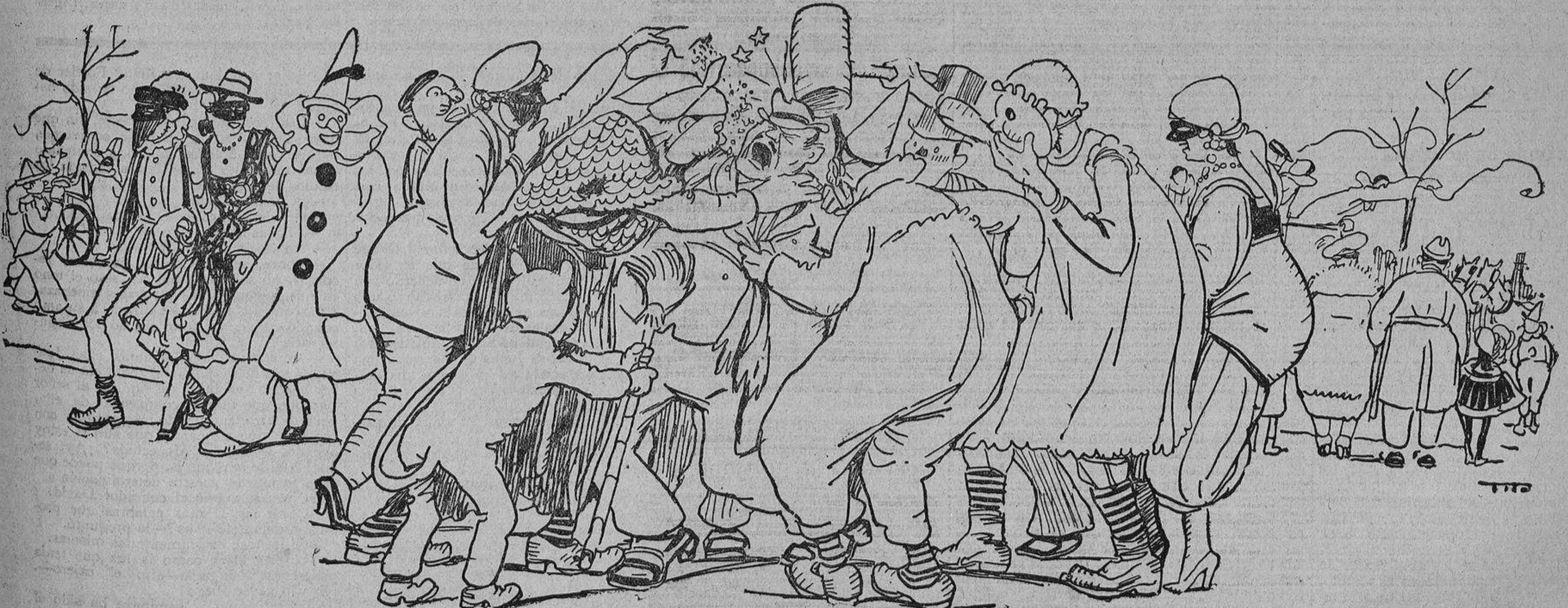
Las delicias de la amistad