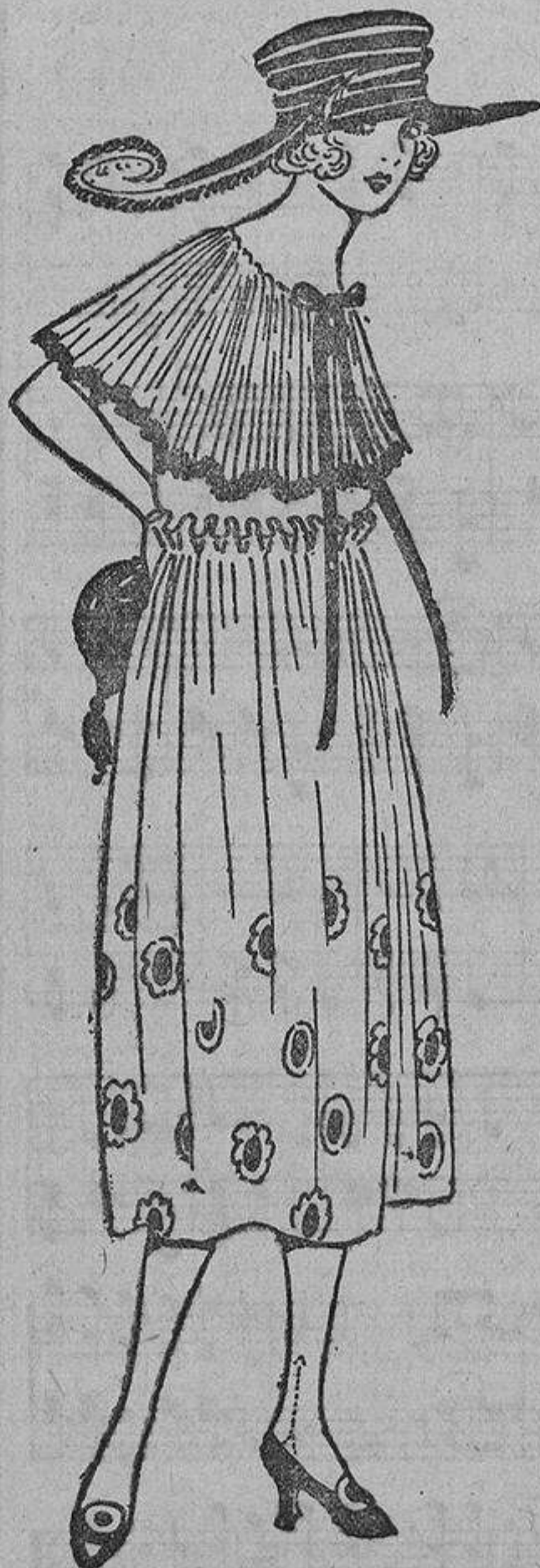
Este vestidito primaveral se puede llevar desde ahora debajo de abrigos para los tés, bailes de moda o para el teatro; es de grueso crespón rosa bordado con motas azules; la falda en la cintura montada con cabeza. Gran cuello de tul plisado.