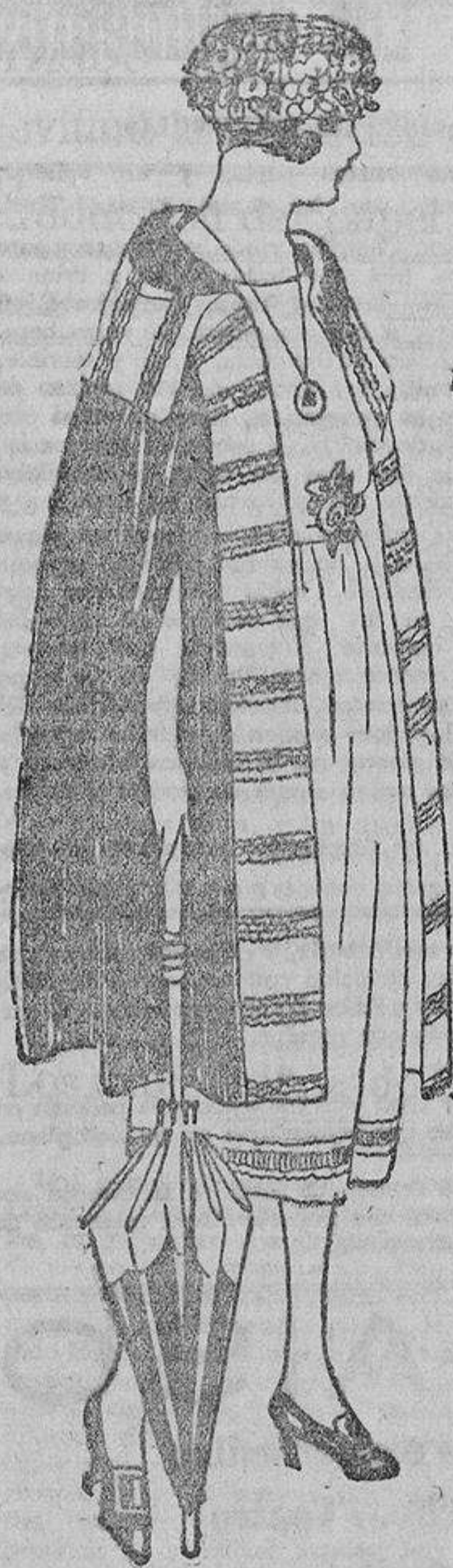
Una capa sencilla de «tricot» de seda negra adornada con «tricot» negro rayado en oro viejo.