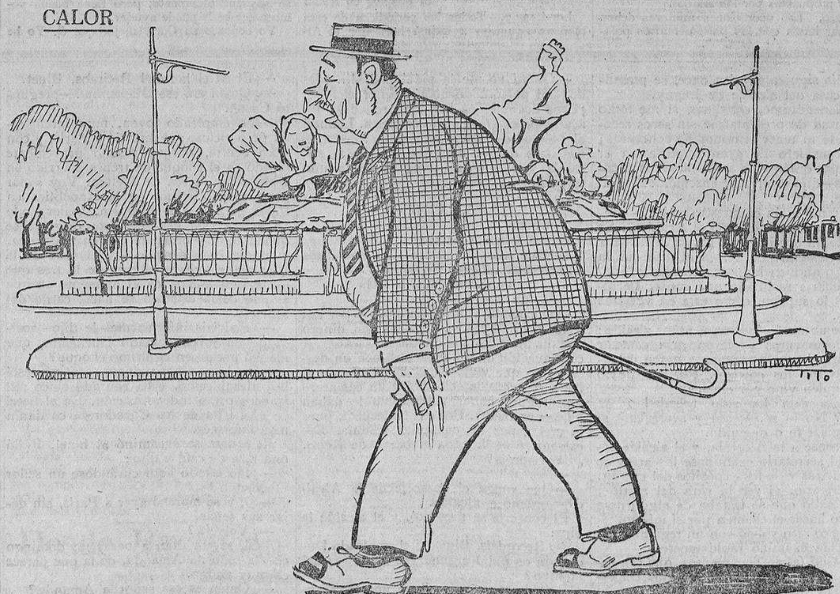
—¡Y aún dicen que tengo "buena sombra,"!

LA ALIANZA FRANCOBELGA La opinión de Vandervelde París, 7.—El corresponsal en Ginebra de L'Echo de Paris comunica: «He aprovechado la presencia en Ginebra de tres de los principales jefes del socialismo belga para preguntarle su opinión sobre el proyecto de alianza franco-belga. Vandervelde, ministro de Justicia, hizo la siguiente declaración: «No soy germanófilo. Soy internacionalista. Comparto la opinión unánime de los miembros del Gobierno belga sobre la necesidad de un acuerdo definitivo entre Bélgica y Francia, y si es posible, con la Gran Bretaña. Lo que es cierto igualmente es que, de acuerdo con mis amigos del partido obrero, me mostraría hostil a un a alianzas, que por otra parte nadie con responsabilidad propone, por la cual se impusieran a Bélgica cargas militares agobiadoras y que favorecieran las miras de la política nacionalista e imperialista, que serían un obstáculo para el restablecimiento de una paz verdadera en Europa. En cuanto a mi amistad con Francia, mis actos, mi formación intelectual, mi admiración por el esfuerzo maravilloso que ha venido realizando a través de los siglos por la causa de la libertad de la Humanidad son otros tantos títulos que hacen ridículas, cuando no odiosas, las insinuaciones de los que tratan de ponerla en tela de juicio.» (Agencia Radio.)