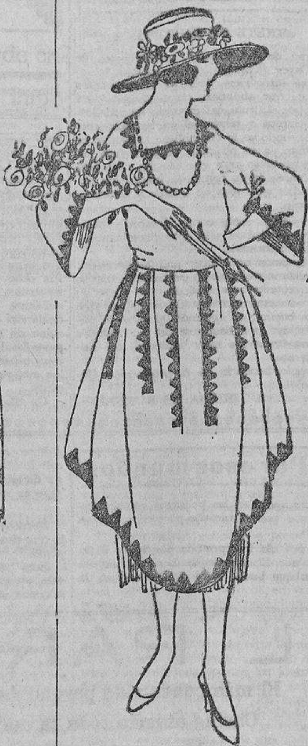
Sobre la ingenuidad de un organdí blanco, unas tiras incrustadas en color y blancas, si el organdí es de color.