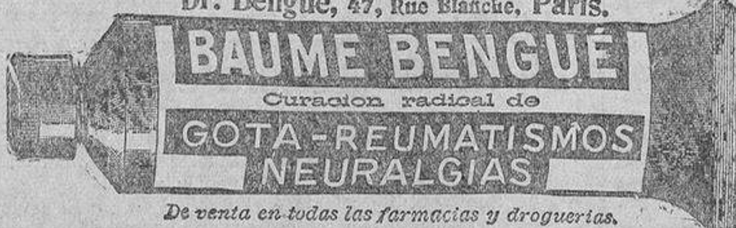
De venta en todas las farmacias y droguerías.