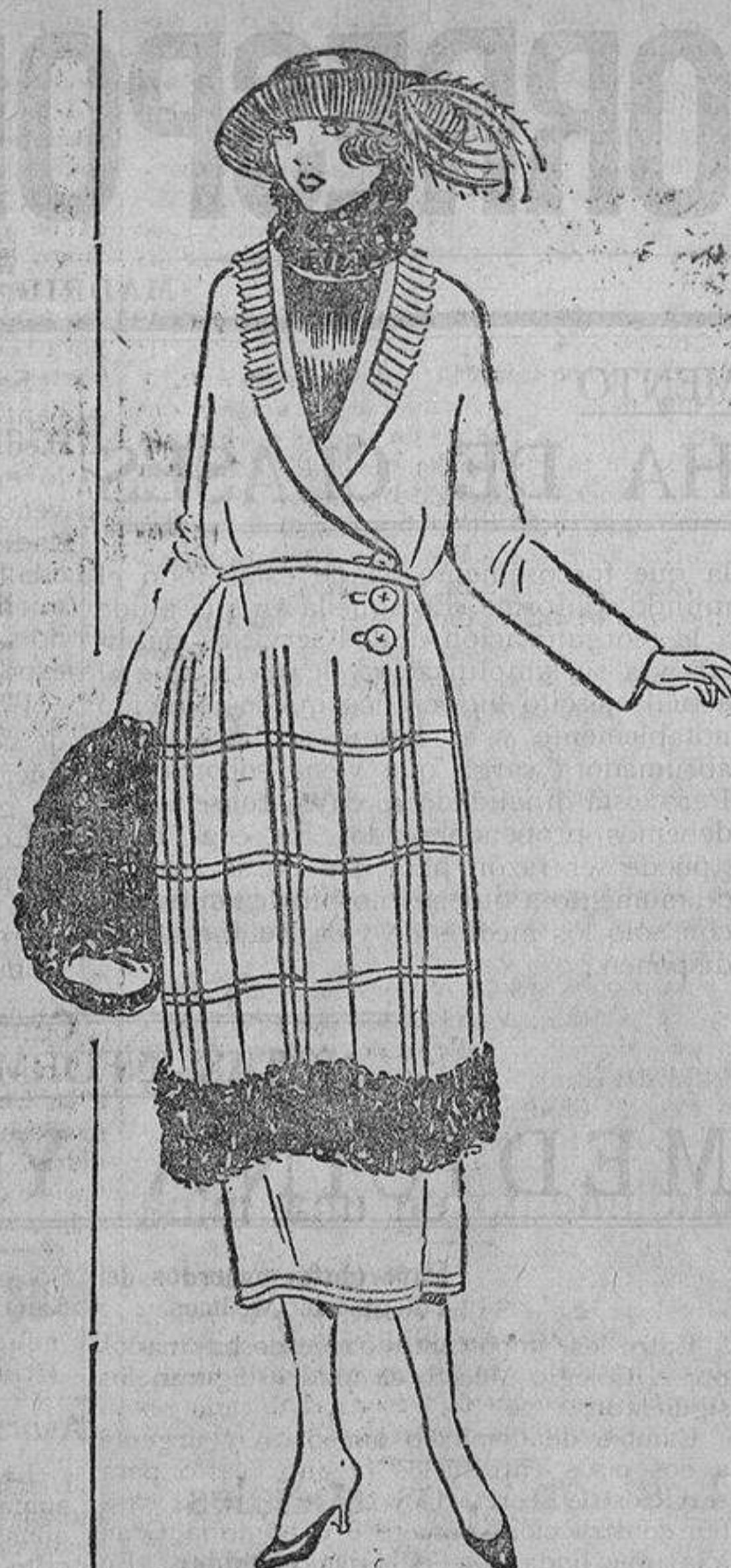
Sobre un terciopelo de lana verde mirto, unas firtas de charol o tela encerada y piel de nutria o de caracul.

en las manos, friccionarlas, agitarlas, frotarlas; pero no las acerquéis al fuego; de vez en cuando, fricciones de alcohol alcanforado.