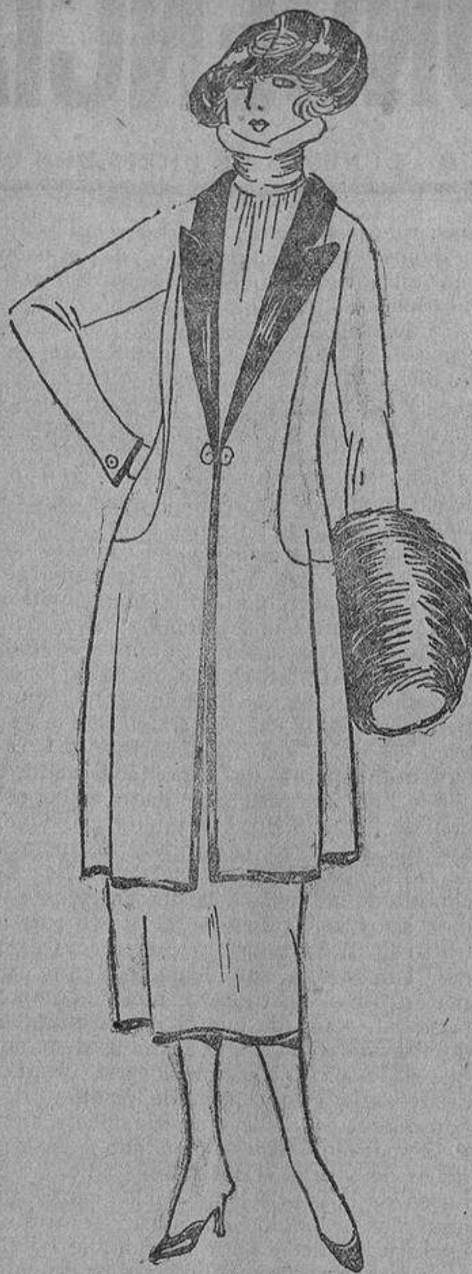
Clásico traje sastre, azul marino; solapas de raso o de su misma tela y trenillas negras.