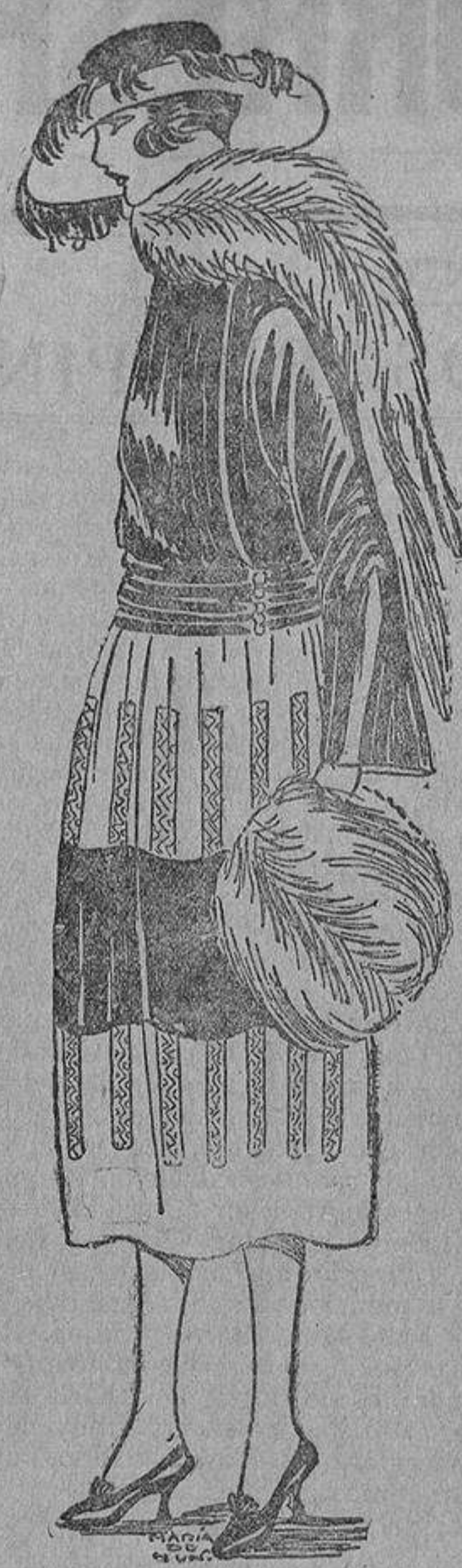
Una idea bonita para un «arreglo». El cuerpo de terciopelo negro, así como la tira del centro de la falda, y lo demás de taletán o paño con unos bordados que pueden ser negros o de color.