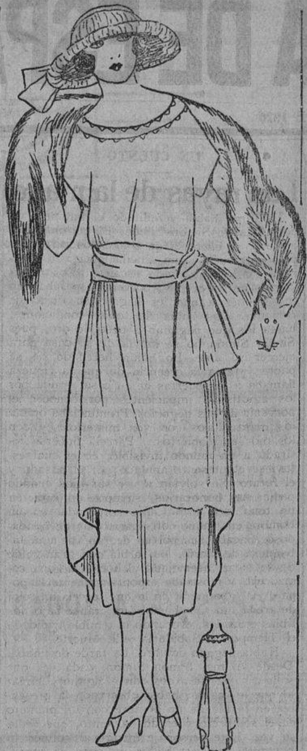
La sobrefalda de este modelo de terciopelo color cobre, no llega detrás, se detiene a los lados, en un movimiento de delante.

«¿Y por qué suponer que en un rincón ignorado vivirías menos? Allí te aburrirías, y aburrirse, ¿no es vivir? Tendrías que saborear la vida minuto por minuto, mirando la hora... bostezando... Tendrías pensamientos funebres... Llegarías a ir descubriendo en tu rostro nuevas arrugas... Te arreglarías las uñas... La poca gente que frecuentases la encontrarías sosa o de mal carácter... Volverías