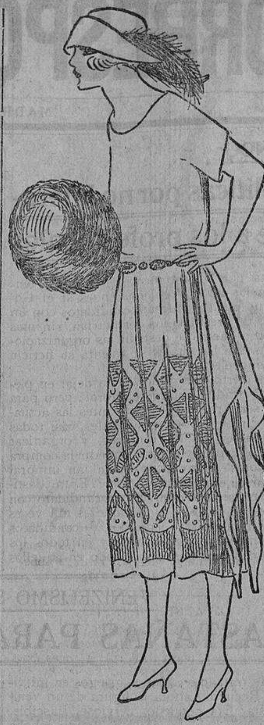
Muy chic este vestido de «chameuse» marrón bordado con hilo de oro.

a mirar la hora... a bostezar... Y así todos los días, que te parecerían interminables y de una monotonía desesperante.