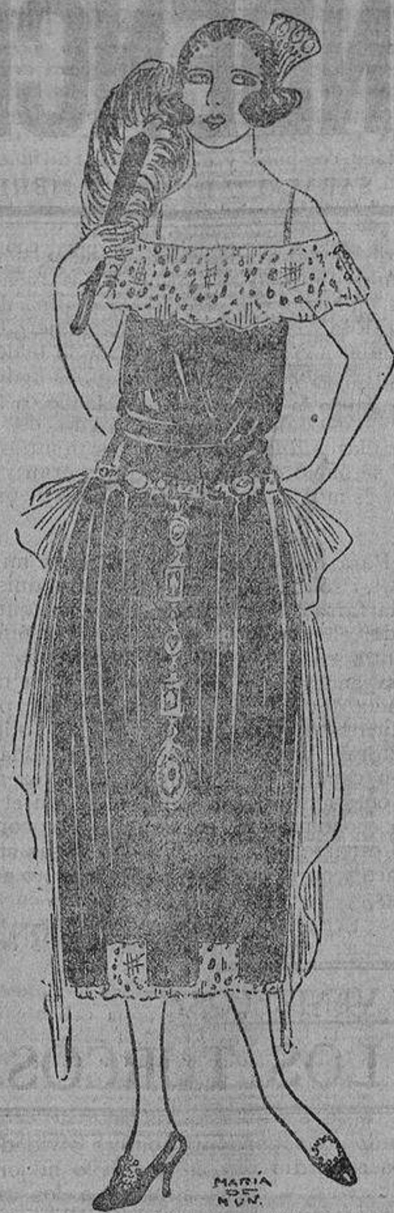
Para baile este acertado modelo, de terciopelo negro con cinturón de placas de galalita fresca y tul del mismo tono bordado en azabache.