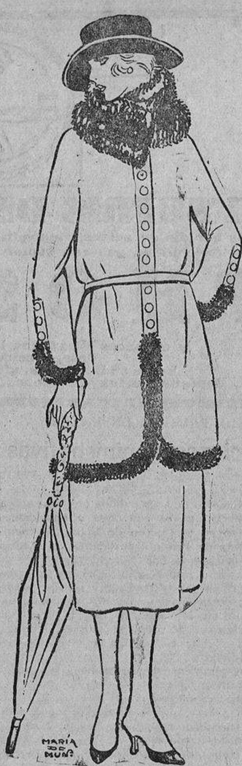
Duvelina color verde oscuro; tiras de su misma tela y botones de acero (gran novedad). Piel de nutria.

La moda se siente esta temporada feroz y se ensaña cruelmente sobre seres ino-