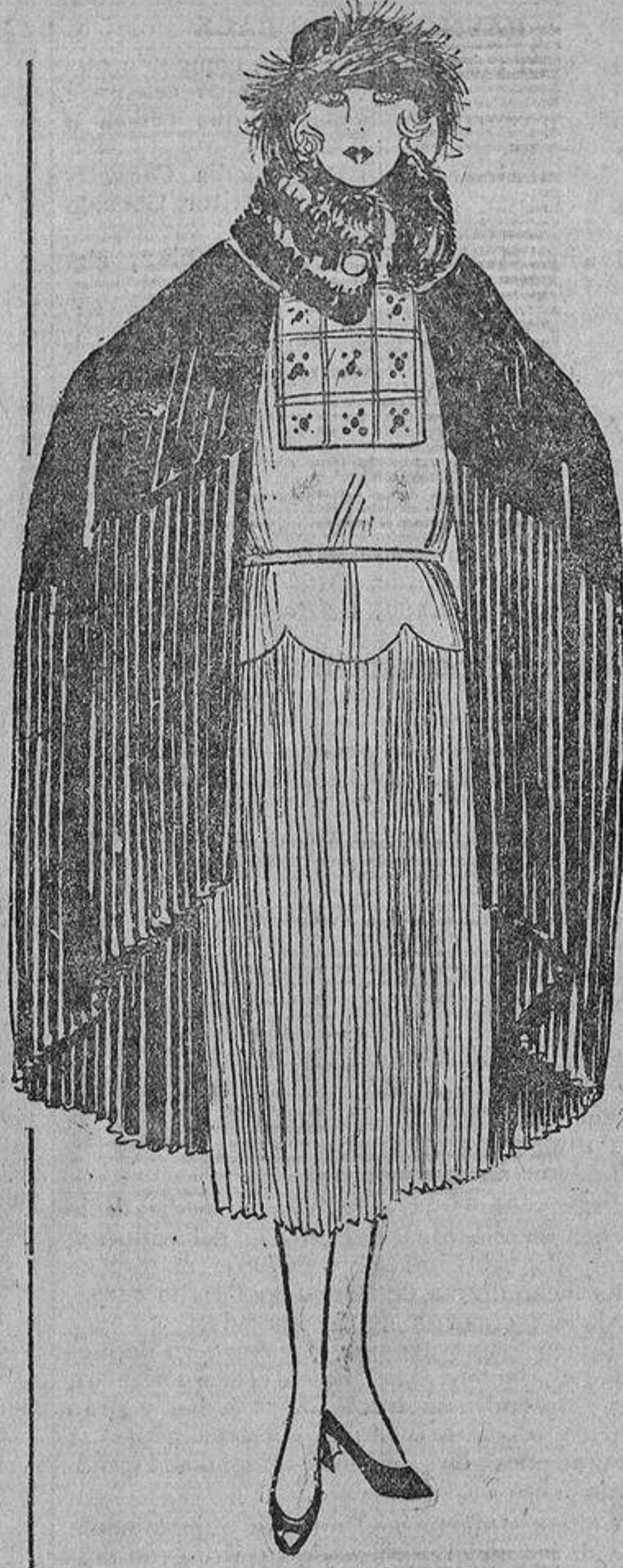
Sobre un vestido de crespón de China azul, con bordados en el pecho, grises y acero, una capa de gabardina marino plisada... y un automóvil a la puerta.