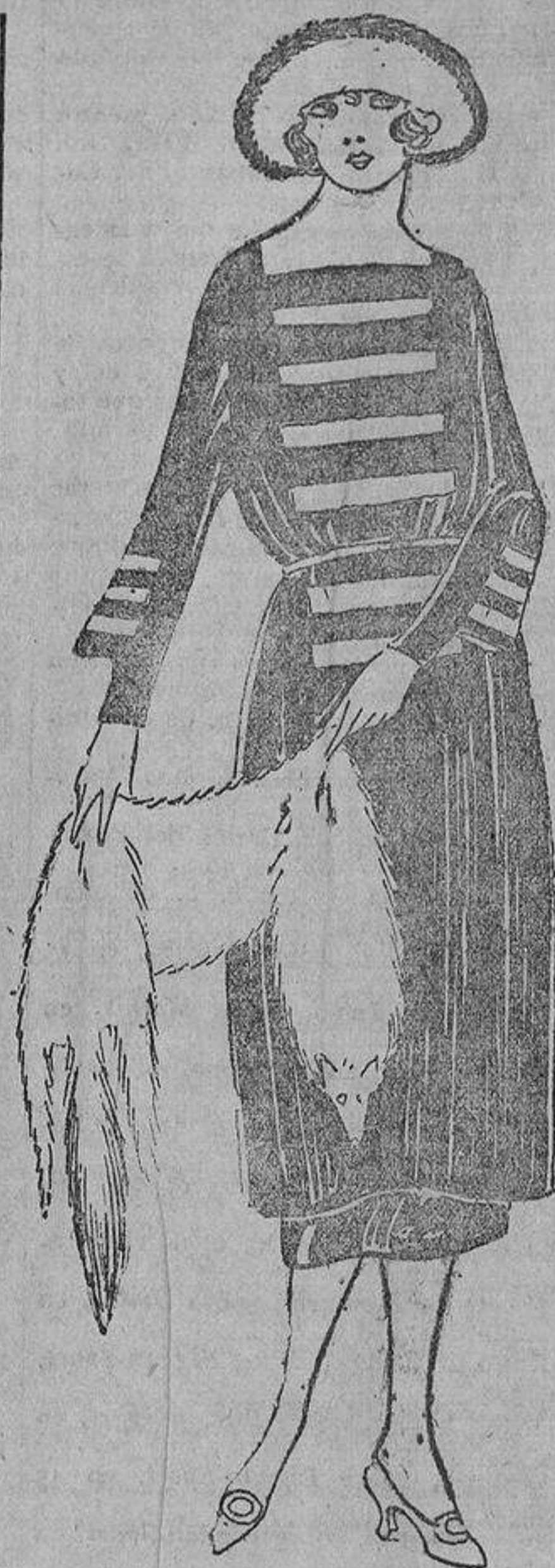
Se llevarán mucho las incrustaciones de paño, por ejemplo, azul «nattier», sobre fondo marino, como sucede en este modelo