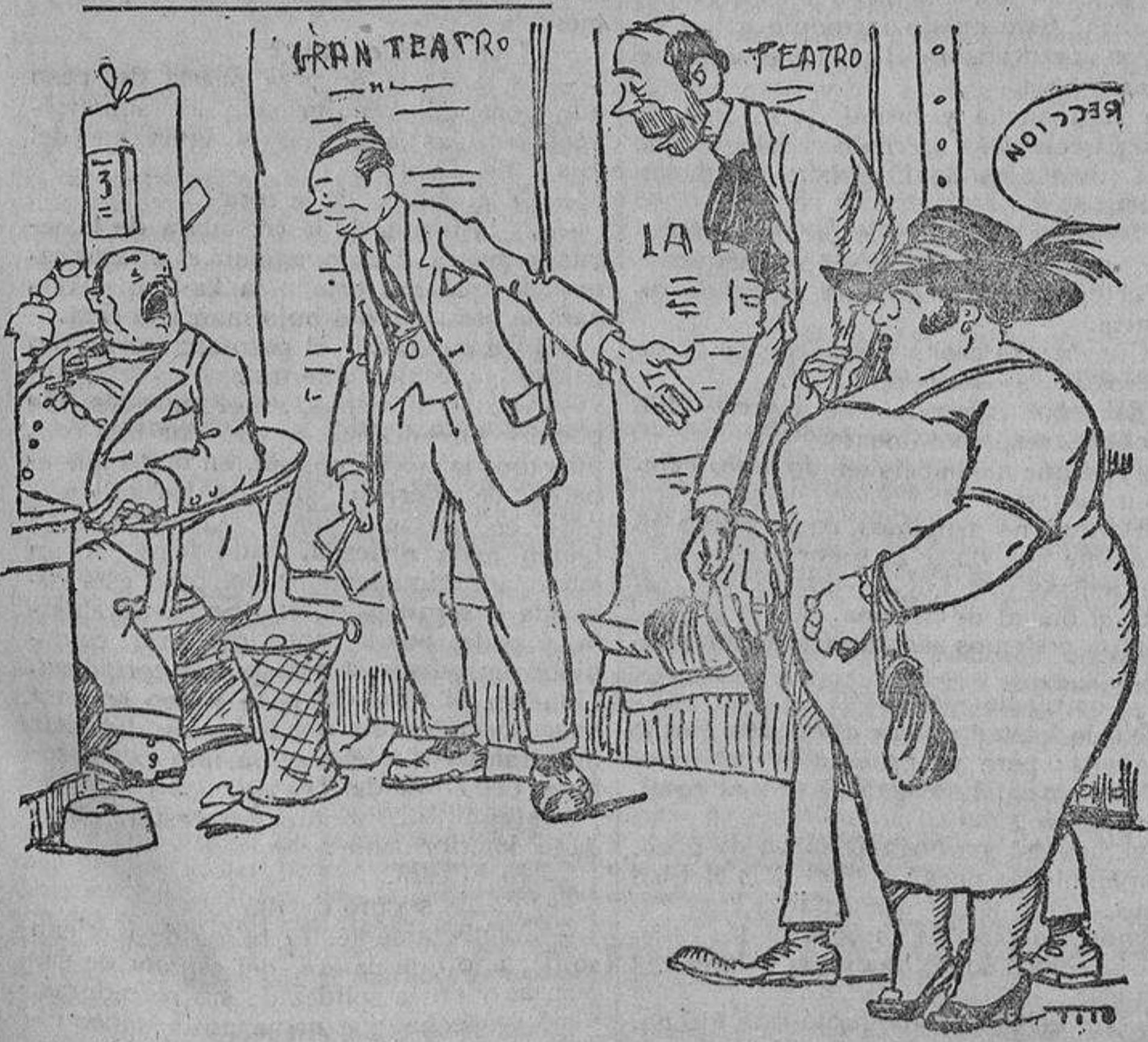
—¡Tengo el gusto de presentarle a la tiple ligera y al bajol...