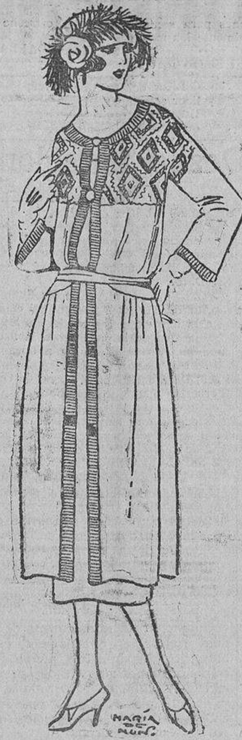
Punto de seda marino, bordados azul «nattier» y tira, bordeándolo, azul «nattier».