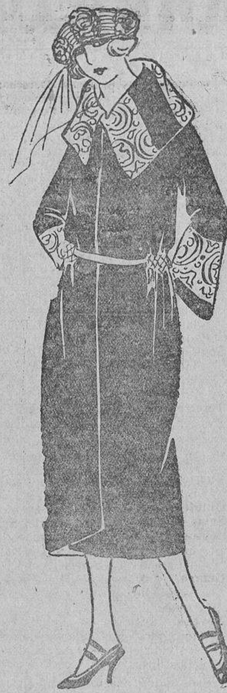
Sencillo abrigo de duvetina cobre, bordados hechos con «soutache» negro.

migos» tan irreconciliables como el perro y el gato, se buscan continuamente y no pueden vivir el uno sin el otro?