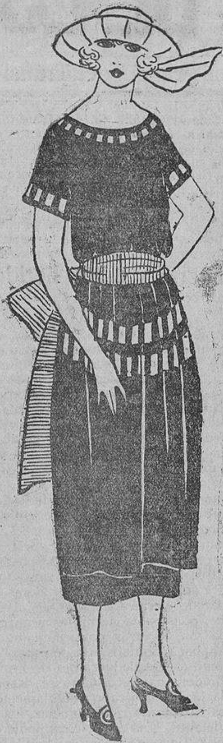
De gabardina azul marino, entredosés de tiras de la misma tela, sobre fondo rojo. La sobrefalda va unida a los lados. Espalda lisa.